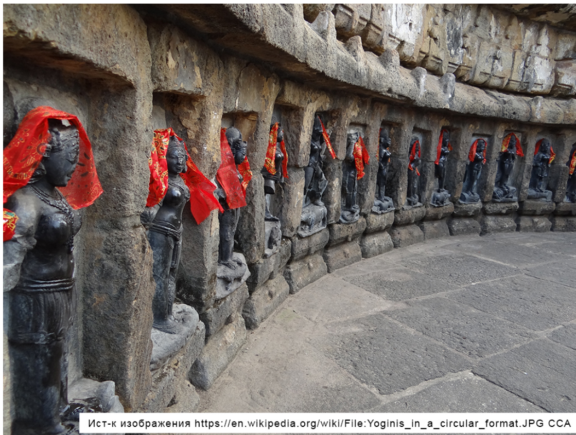
Храм 64 йогини.

полагают, что крыши в этих храмах отсутствуют потому, что йогини слетались в них с небес, и эти строения выполняли функцию некоего аэродрома.