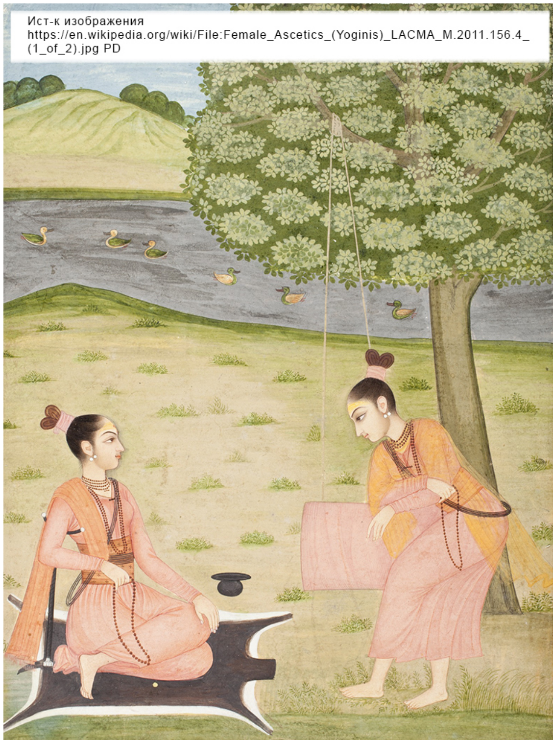
Женщины-шайвы. Живопись XVIII века.

Лингаиты ставят себя вне общего потока индуизма, добиваясь признания своей веры отдельной и самостоятельной религией.