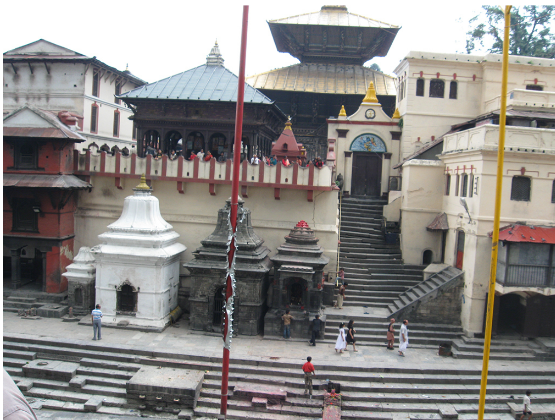
Храмовый комплекс Пашупатинатх – важный центр паломничества для всех почитателей Шивы.

Первоначально эта школа приветствовала присоединение к ней любого человека без различия касты и социального положения. Но в дальнейшем по мере того, как к пашупатам присоединялось все больше брахманов, школа стала доступной только для представителей высших каст и постепенно из крайне аскетической превратилась в популярный духовный путь для людей, живущих обычной мирской жизнью. Последователи этого культа существуют по сей день, а их религиозные центры разбросаны по всей Индии. В VIII веке традиция пашупатов распространилась в Непале – единственной стране в мире, где индуизм является государственной религией. Огромный храмовый комплекс Пашупатинатх, расположенный на окраине Катманду – столицы Непала – является важным центром паломничества для всех почитателей Шивы по сей день.