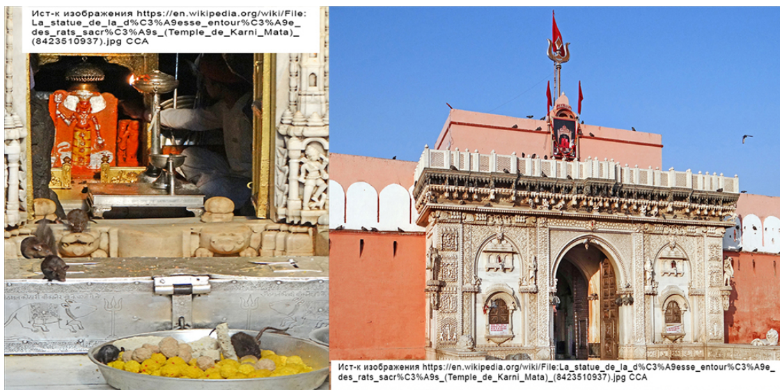
«Храм Крыс» внутри (слева) и снаружи (справа).