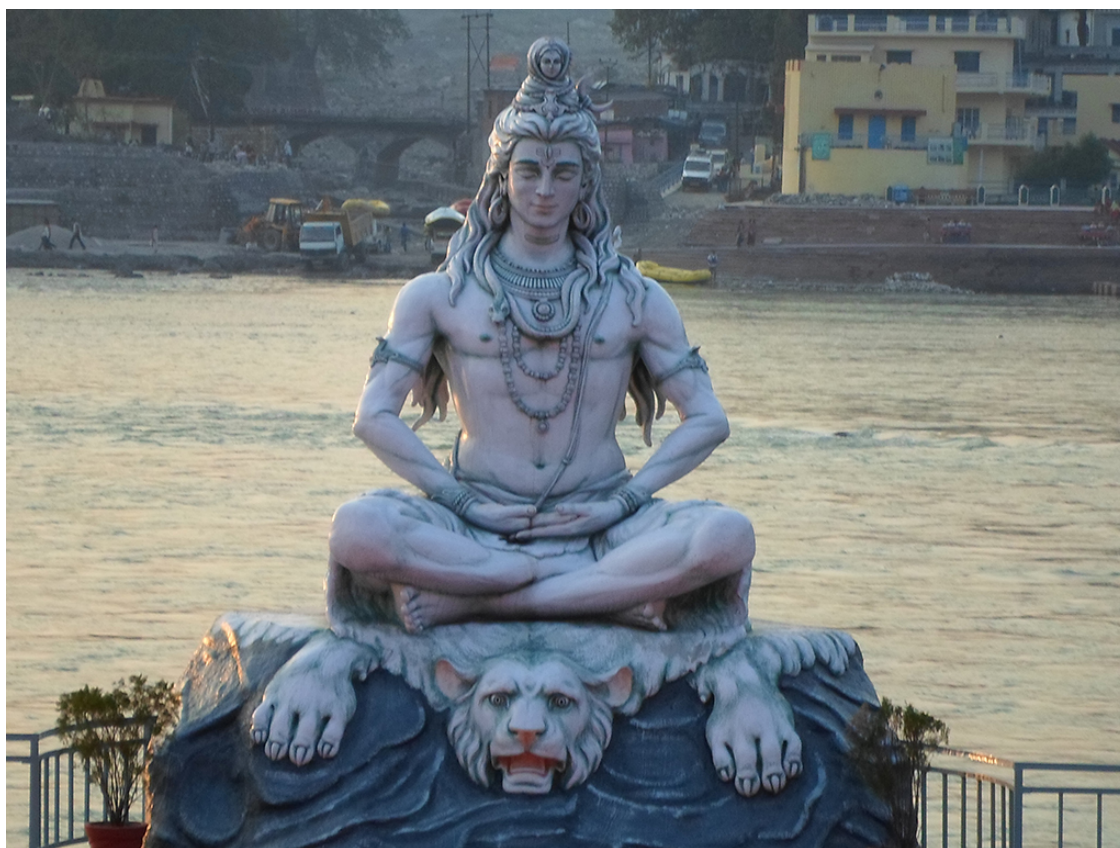
Статуя бога Шивы в образе погруженного в медитацию йогина, с третьим глазом на лбу, полумесяцем в волосах, украшениями из змей и зерен рудракши и Гангой на голове.

Эта противоречивость образа Шивы нашла отражение в иконографии: в скульптурах, на изображениях он представлен во множестве форм. Шива изображается в виде погруженного в медитацию йогина, с третьим глазом, полумесяцем в волосах, украшениями из змей и зерен рудракши. Или вместе со своей супругой Парвати и сидящими у них на коленях сыновьями – Ганешей и Скандой. Популярно изображение Шивы Натараджа – Шивы, танцующего в огненном кольце Танец творения и разрушения вселенной – Тандава. Чаще всего Шива изображается четырехруким, но есть и изображения с восемью руками.