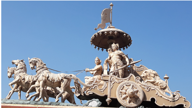
Скульптура, изображающая Кришну (сидит) и Арджуну (стоит) перед сражением на Курукиштре.

Бхагавадгита представляет собой диалог между одним из главных героев – Арджуной, который является непревзойденным воином армии Пандавов, и Кришной. Кришна – одна из самых значимых фигур индуистского пантеона и один из самых почитаемых богов индуизма. В Махабхарате Кришна является воплощением Бога на земле в человеческом теле – восьмым воплощением – аватаром господина Вишну. Пребывая на земле в человеческом теле, он живет как обычный человек, вернее, как обычный царь, т. к. является принцем одного из царских родов, и другом Арджуны. Но в то же время Кришна – это воплощенный бог, ограниченный человеческим телом и человеческим существованием, но обладаю-