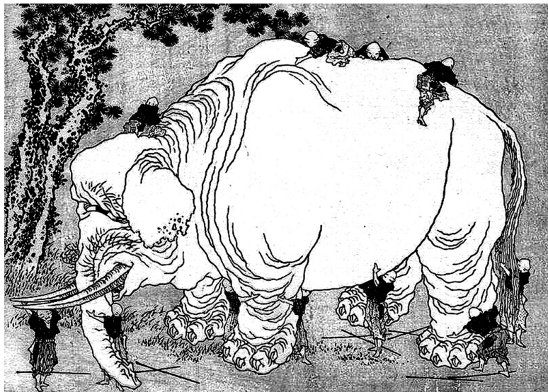
Кацусика Хокусай «Слепцы и слон»

как развивалась, какими людьми были первые практики йоги, как они жили, к чему стремились, о чем мечтали? На протяжении тысячелетий менялась жизнь, люди и мир вокруг них, и вместе с этим менялась и развивалась йога. Как из множества ручейков и маленьких речек образуется великая река, так и йога сложилась из множества разных традиций, верований, идей, практик. И этот процесс не останавливается, он не прекратился, и сегодня йога продолжает развиваться и видоизменяться, отражая в себе, как в зеркале, современный мир и делая его лучше.