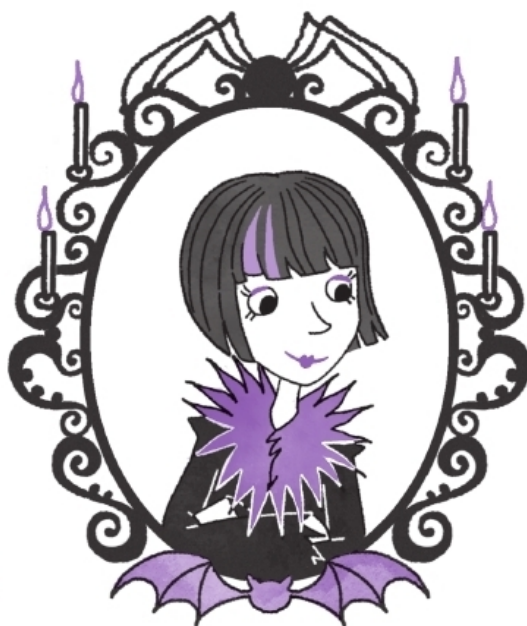
Моя мама Серафина Луч