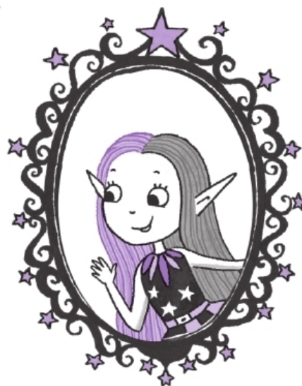
Я! Мирабель Луч