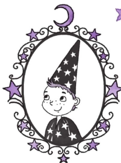
Мой братик Уилбур Луч