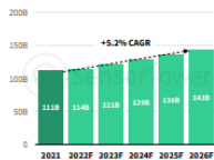
Worldwide Google Play Downloads