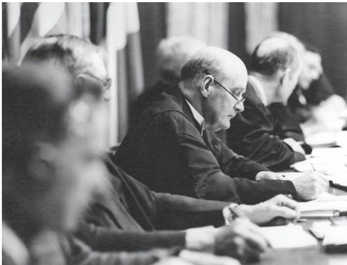
Судья Дж. Лоуренс на заседании Нюрнбергского суда.

Председателем трибунала на единственном заседании в Берлине был выбран англичанин Джеффри Лоуренс. Он же прибыл и в Нюрнберг.