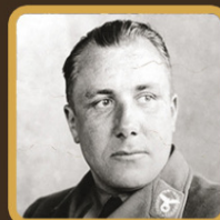
КАК ПОГИБ МАРТИН БОРМАН?