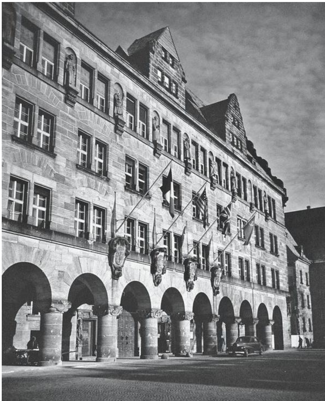
Дворец юстиции с флагами четырех стран, сформировавших Международный трибунал. 1945 год

В своей книге «Нюрнберг: перед судом истории» юрист М. Ю. Рагинский писал о Нюрнбергском процессе, в котором он лично принимал участие, следующее: