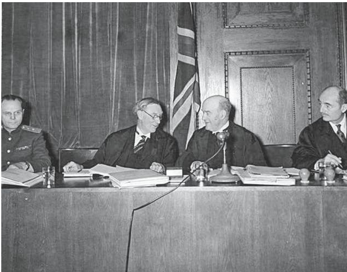
Британские судьи Биркетт и Лоуренс (в центре).

Отдельным списком шли главные обвинители – тоже по одному человеку от СССР, США, Великобритании и Франции. Заместителей у каждого из них, как правило, было двое, хотя советская сторона сумела ввести в трибунал еще четверых помощников заместителя главного обвинителя.