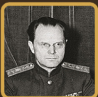
ЗАГАДОЧНОЕ УБИЙСТВО СОВЕТСКОГО СУДЬИ