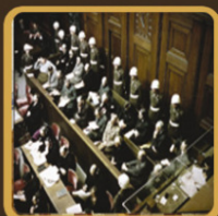
ПОЛНЫЙ СОСТАВ ТРИБУНАЛА