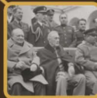
КТО НАСТОЯЛ НА ПУБЛИЧНОМ ПРОЦЕССЕ