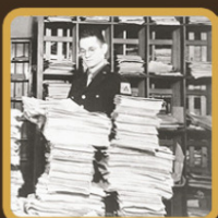
АДВОКАТЫ НАЦИСТСКИХ ПРЕСТУПНИКОВ