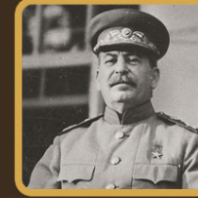
ЧЕГО БОЯЛСЯ ИОСИФ СТАЛИН?