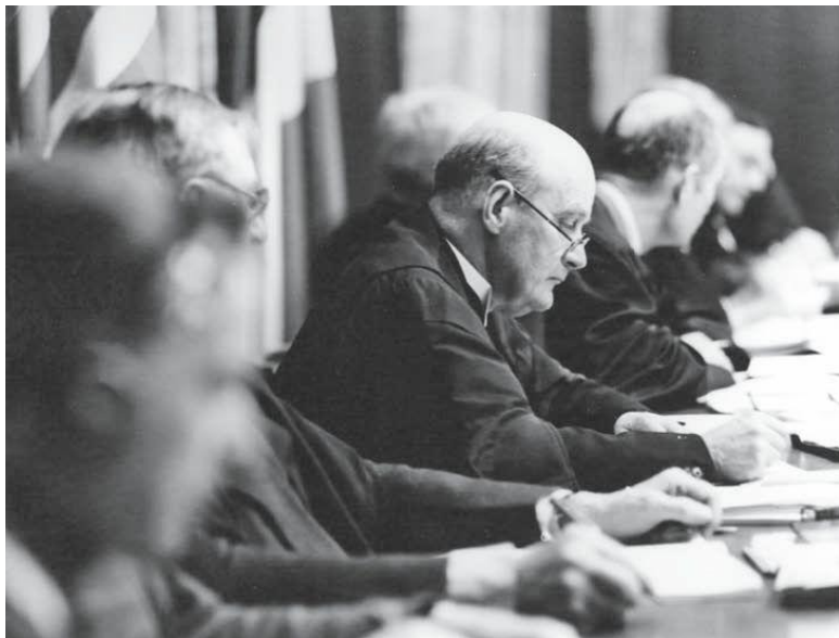
Судья Дж. Лоуренс на заседании Нюрнбергского суда.