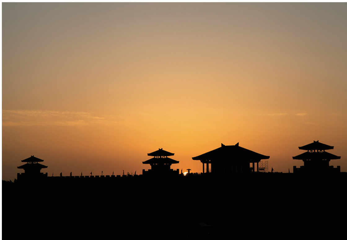
Застава Янгуань.

В 1979 году Дуньхуан был внесен Госсоветом КНР в число городов, открытых внешнему миру, в 1986 году государство присудило ему звание «Китайского города с богатым культурно-историческим наследием», а в 1987 году ЮНЕСКО внесла пещеры Могао в Дуньхуане в список Всемирного культурного наследия.