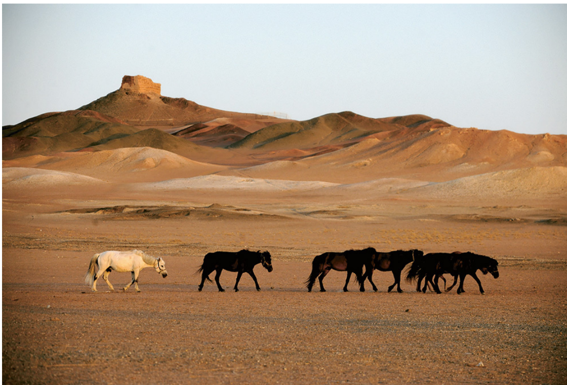
Сигнальная башня заставы Янгуань.