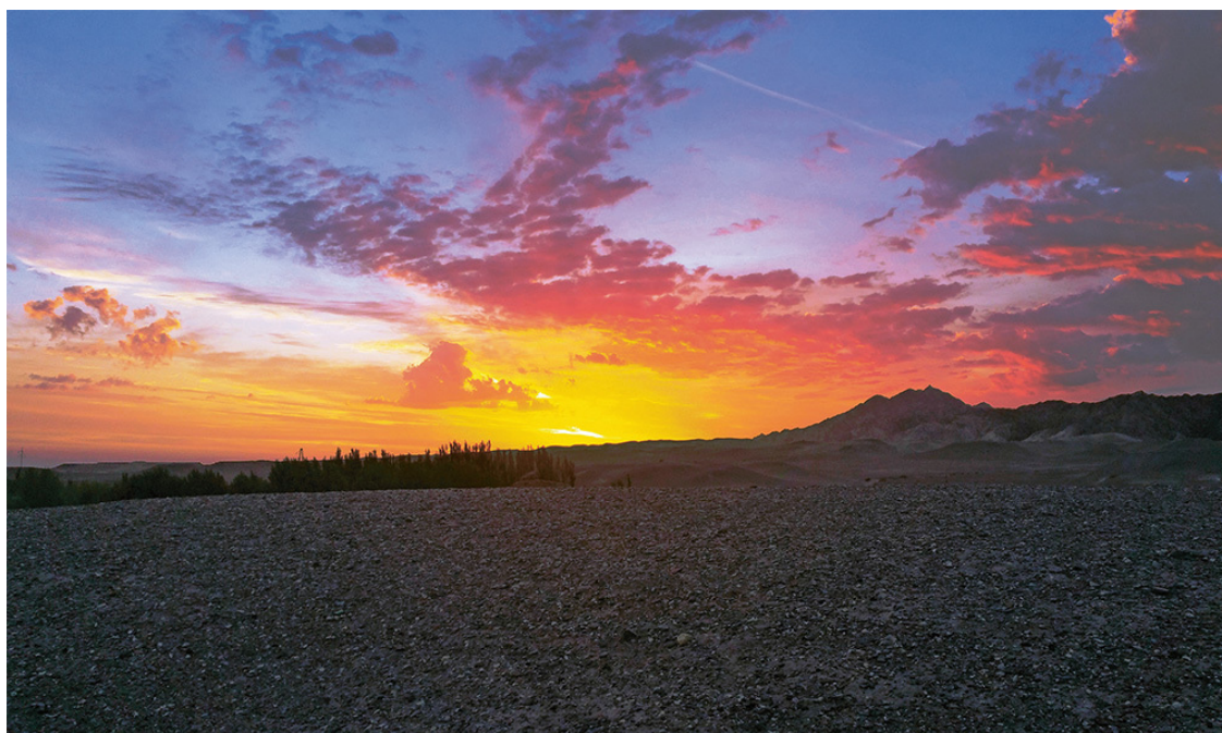
Рассвет над горой Саньвэйшань