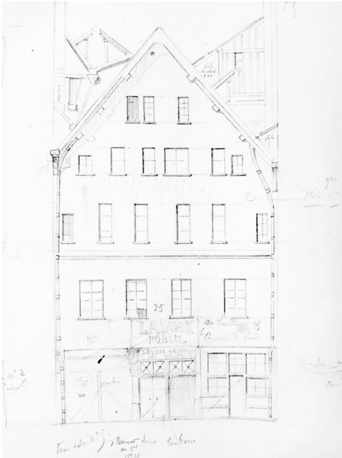
Чертежи Габриэля Давиу

Через несколько лет барон Осман нанял официального фотографа, который запечатлел исчезающий город, чтобы дополнить работу Давиу. Но серия фотографий не охватила столько зданий, сколько было начерчено в драгоценной коллекции архитектора.