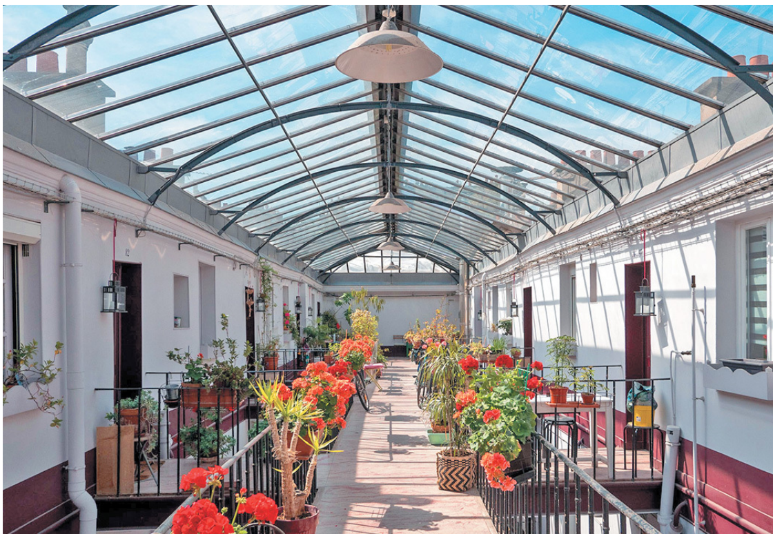
Интерьер Сите Рошшуар

Первый Сите Рошшуар был торжественно открыт в 1851 году и сразу стал жертвой ожесточенных дебатов и критики. «Город рабочих» представлял собой четырехэтажный комплекс с внутренним двором и всей необходимой инфраструктурой: прачечными, сушилками, банями и подобием детского сада. На входе круглосуточно находилась охрана, следящая за порядком. Приближенные к власти были обеспокоены высокой концентрацией рабочих, зная любовь французов к забастовкам и бунтам. При этом для низших слоев цена аренды социального жилья была слишком высока, а средний класс не хотел жить в «казарме» под охраной. Несмотря на первый неудачный опыт, Наполеон, увлеченный социальным жильем, продолжит разрабатывать все новые и новые проекты по всей Франции. Позже он будет участвовать в разработке плана комплекса из 41 павильона для рабочего класса на авеню Домениль. Проект представят на Всемирной выставке в 1867 году, Наполеон, без сюрпризов, станет лауреатом за инновацию в строительстве. Интересный момент, что и сегодня Сите Рошшуар по-прежнему является социальным жильем и находится под охраной государства как исторический памятник архитектуры.