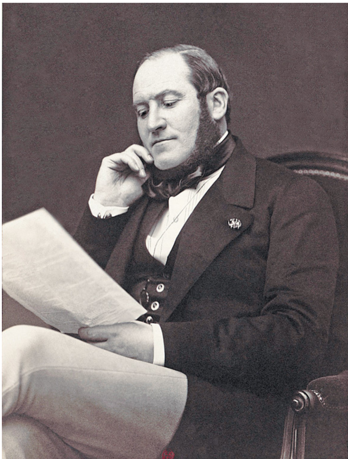
Барон Осман в 1860 году

Трудолюбивый, прямолинейный, ростом под два метра, с внушительной фигурой, Осман завоевал авторитет за двадцатилетнюю карьеру в регионах. Поклонник бонапартизма, он быстро снискал уважение племянника Наполеона I. «Император спешил показать мне карту Парижа, исчерченную им лично синим, красным, желтым и зеленым, новые пути, которые он предлагал создать», – вспоминал Осман о первых встречах с Наполеоном. Между императором и его префектом возникают химия, доверие и полное согласие. Они находятся в постоянном контакте. День и ночь гонцы доставляют срочные сообщения из дворца Тюильри или резиденции Сен-Клу, где обитал император, в парижскую ратушу и обратно. Ни Наполеон III,