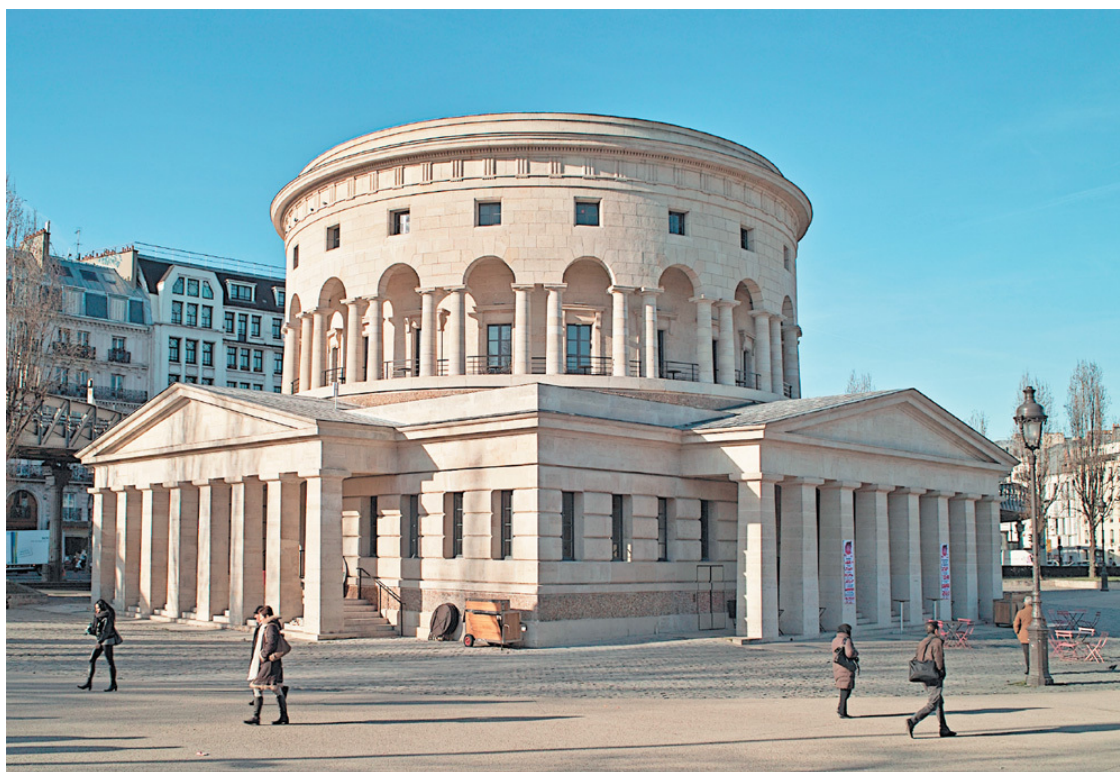
Ротонда Николя Леду возле станции метро «Сталинград»

Ближе к концу XVIII века создание осей в центре Парижа представлялось властями как острая необходимость: этому подчинялась застройка набережных Сены и разрушение домов на мостах. Во время французской революции в 1794 году осуществляется план по созданию улицы, соединяющей площадь Нации с большой колоннадой Лувра по прямой линии. Являясь продолжением авеню Виктория, улица предвосхищает будущую главную ось восток – запад. В 1807 году, во время правления Наполеона Бонапарта, начинается строительство первых аркад на улице Риволи, являющейся сейчас центральной улицей города. В 1830-е годы префект Рамбюто отмечал проблемы с гигиеной в переполненных старых кварталах: «В миссии, возложенной на меня Вашим Величеством, я никогда не забуду, что моя первая обязанность – обеспечить парижан водой, воздухом и тенью» 10 . В 1836 году в центре Парижа, между улицами Франс-Буржуа и Сент-Эташ, была проложена улица, носящая и по сей день его имя. Правда, довольно скромная по масштабам Османа, всего 13 метров в ширину. Рамбюто очистил тротуары, создав 450 общественных писсуаров. Недоброжелатели тут же окрестили их «колоннами Рамбюто». Разозлившись, префект переименовал писсуары в «веспасианы» в честь римского императора, который первым обложил налогом сбор мочи, по легенде объявив, что «деньги не пахнут».