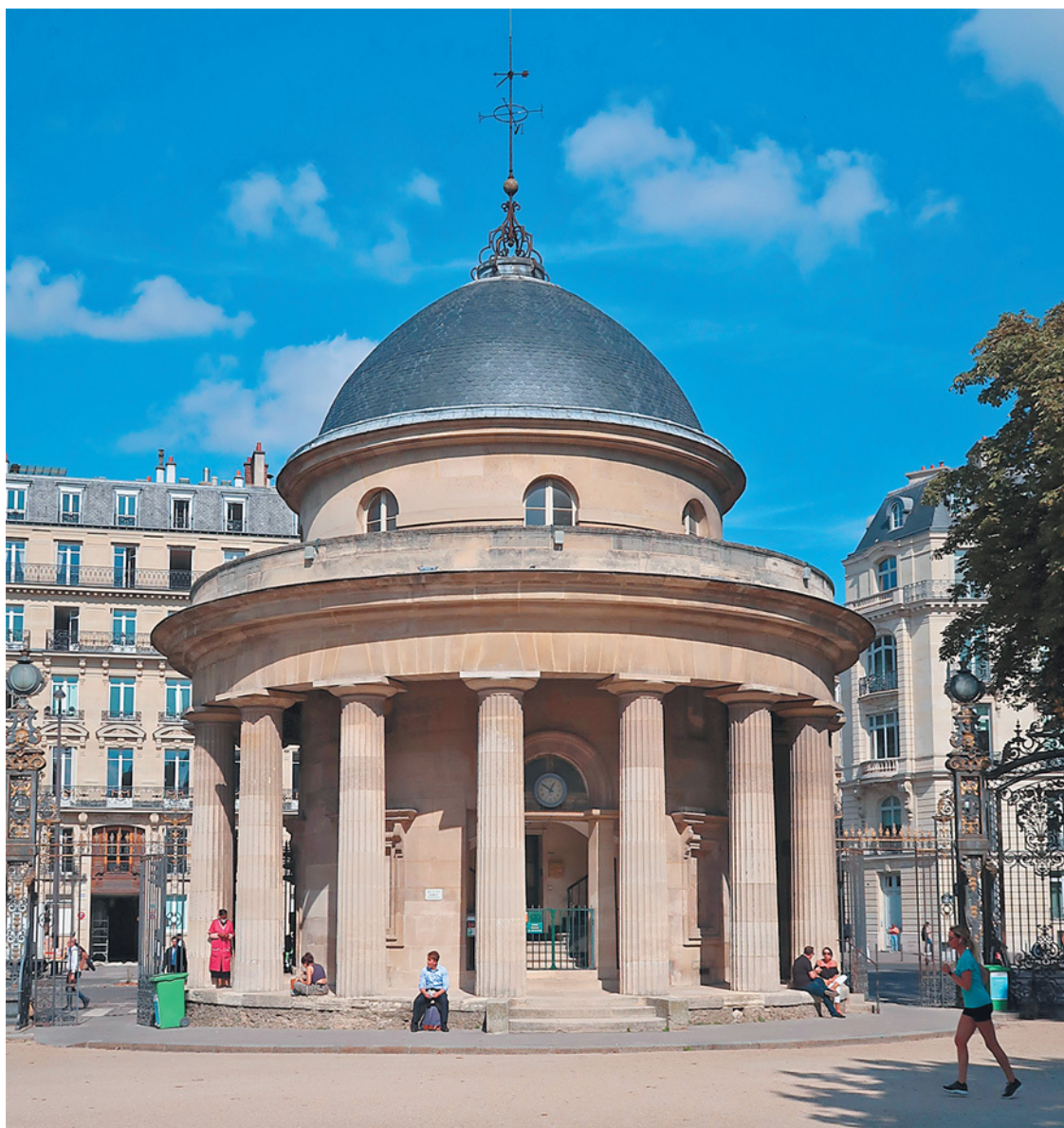
Ротонда возле парка Монсо

В начале XVIII века компенсацию владельцам земли на разрушенной улице полностью или частично выплачивали владельцы соседних улиц. Власти полагали, что их земля выиграет от увеличения стоимости, вызванного строительством новой улицы. В XIX веке ряд законов 1807-го, 1833-го, 1841 годов очень точно регулировал процедуру экспроприации, создав, в частности, суд присяжных под председательством магистрата для определения контрибуций, очень внимательного к рассмотрению претензий собственников. Последний закон об экспроприации земель в общественных интересах от 3 мая 1841 года был принят по инициативе префекта. Правда, Рамбюто так и не успел им воспользоваться, не получив от властей ни оснований, ни средств, необходимых для проведения своей политики модернизации. Зато именно этим законом будет активно пользоваться в более широком масштабе префект Осман с 1853 года.