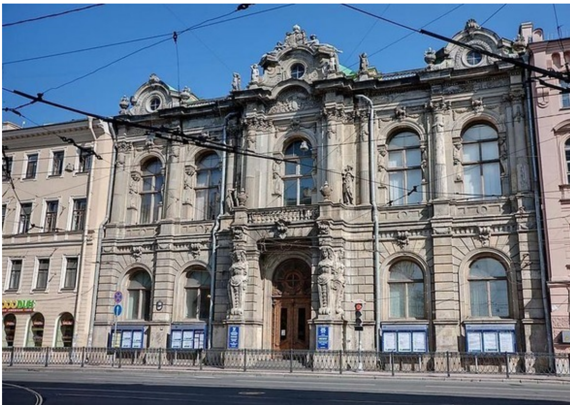
Вид дворца на Литейном проспекте (фото автора конца 1990-х годов)

Мы подошли чуть ближе. Стали с интересом рассматривать фасад. Это был настоящий маленький дворец. Каменная облицовка, декоративные колонны над входом, женские аллегорические статуи, кариатиды, гербы в центральном аттике – все было исполнено в изысканной манере, говорившей о хорошем вкусе и профессионализме неизвестного зодчего.