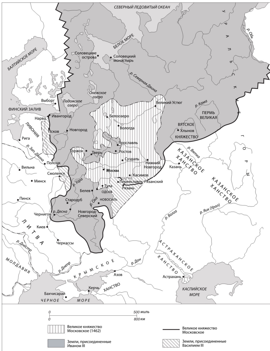
Карта 2. Великое княжество Московское (1462–1533) (взята из атласа «An Atlas of Russian History: Eleven Centuries of Changing Border» А. Ф. Чу [Chew 1971])

Стратегия использования крепостей также оказала большое влияние на ход русско-крымского противостояния, начавшегося после того, как при Василии III распался союз между этими двумя государствами. После 1500 года обе стороны выказывали все меньше интереса в продолжении прежнего сотрудничества. С падением Большой Орды у них больше не было общего врага, а что касалось ситуации с Казанским ханством, то здесь Москва с Крымом не столько действовали заодно, сколько боролись друг с другом за то, чтобы посадить на ханский престол своего ставленника. Нежелание Василия III отправлять крымскому хану и его приближенным щедрые подарки тоже не улучшило положения дел. Не объявляя войны,