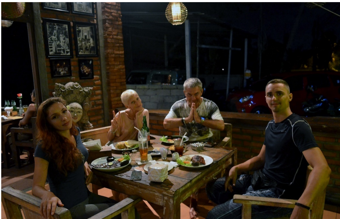
Бали, Убуд. Кафе, вечер