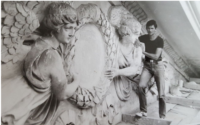
Реставрация фронтона, 1986 г.