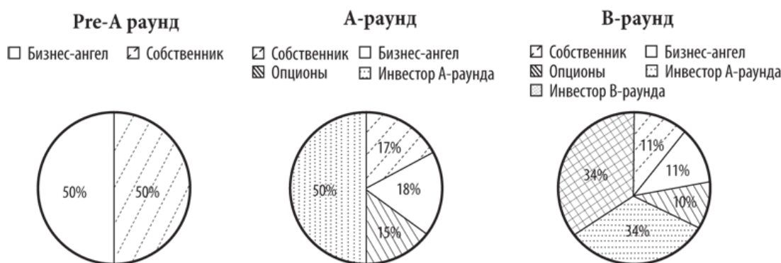
Рис. 1. Пример размывания доли собственника при нескольких раундах финансирования

Почему мы говорим об уменьшении вашей доли в вашей компании? Потому что если весь капитал это 100 % и вам надо привлечь дополнительный капитал, то понятно, что у вас останется меньше, а у тех, кто дал дополнительные деньги, что-то появится.