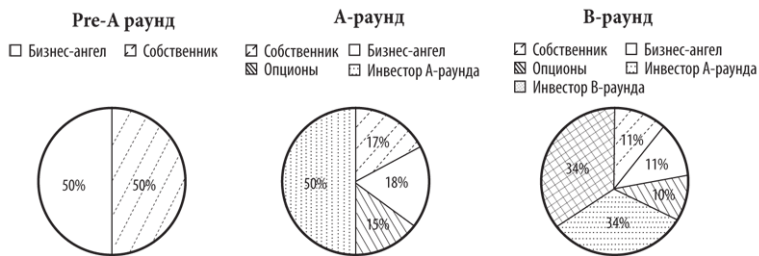
Рис. 1. Пример размытия доли собственника при нескольких раундах финансирования

Почему мы говорим об уменьшении вашей доли в вашей компании? Потому что если весь капитал это 100 % и вам надо привлечь дополнительный капитал, то понятно, что у вас останется меньше, а у тех, кто дал дополнительные деньги, что-то появится.