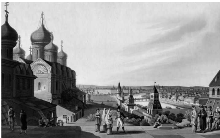
Москва XIX век

какую встретишь только в счастливой Италии... Здесь жили восемьсот или тысяча человек, имевших от пяти до полутора тысяч ливров ренты. Что делать с такими деньгами? У этих бедняг не было иных целей, кроме поиска удовольствий» 26 . Конечно, в словах и того, и другого есть некоторая доля преувеличения, но они, во всяком случае, позволяют увидеть особенности Москвы. Москва – город контрастов, в плане как пейзажей, так и населения.