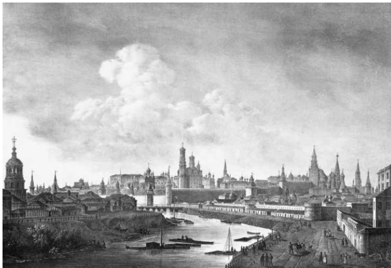
Московский Кремль со стороны Китай-города. XVIII век

находились, в частности, мастерская, где отливали пушки, императорская аптека и университет (1755). Четвертый район именовался Земляной город, он был окружен деревянными укреплениями, сооруженными в 1592–1593 годах, сразу после набега крымских татар. На его территории были расположены полицейское управление, уголовный суд, императорские конюшни, артиллерийские казармы, провиантские склады, хлебопекарни, Воспитательный дом (приют для подкидышей), а также мануфактуры. Все эти постройки занимали много места.