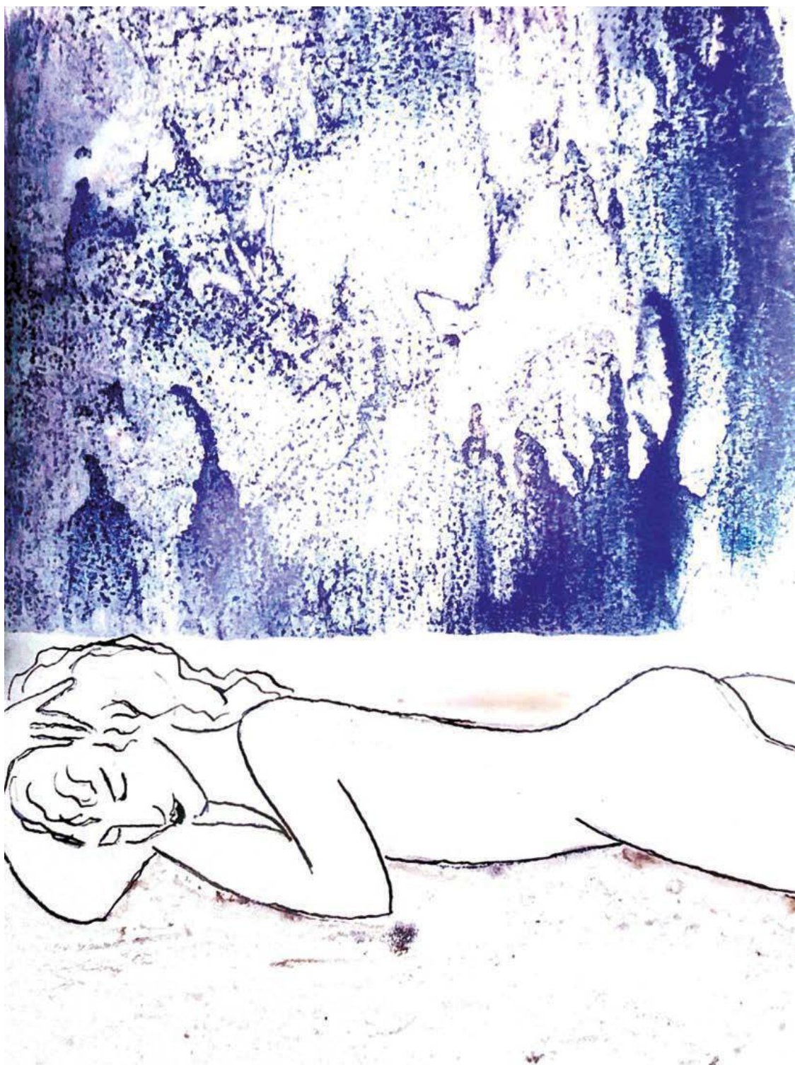
Миниатюрна и манерна. 2015 Монотипия, 33×26 см