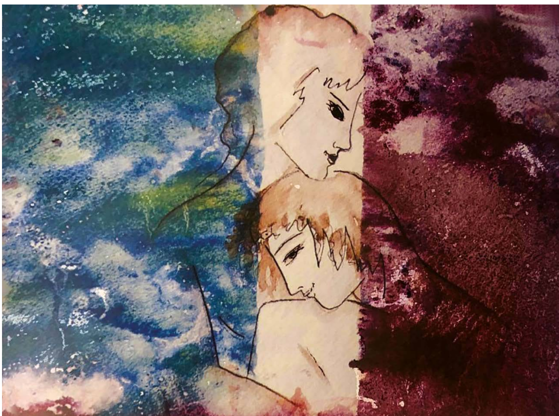
Вкус. 2015 Монотипия, 26×33 см

Вкус сладких губ, объятия, нежность... Зачем наказывать себя? Я не могу позволить слабость. Не потеряв, нельзя найти себя. Нас наделил Создатель чувством, Оно струится по душе. Но мы не ценим, что имеем, И убиваем всё в себе. Мы все живём в своём футляре, И, только щёлочку открыв, Порыв сбивает все терзания, И нам не нужен тесный мир.