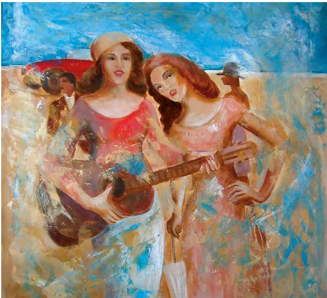
Музыка. 2006 Холст, масло. 81×73 см

Песнь о любви под звук гитары, Волна чарующих реалий Под ритм двух голосов. История о том, как двое были вместе, Как яркость красок охлаждала пыл. История до боли интересна, Когда поймаем мысль, заметим стиль. Давай представим длинную дорогу, Когда в пути встречается любовь. Что нужно здесь, когда им на подмогу Приходит интерес? Опустим мелкие детали, Опустим всё, что можно опустить. Но не всегда встречается гитара, Когда струна молчит.