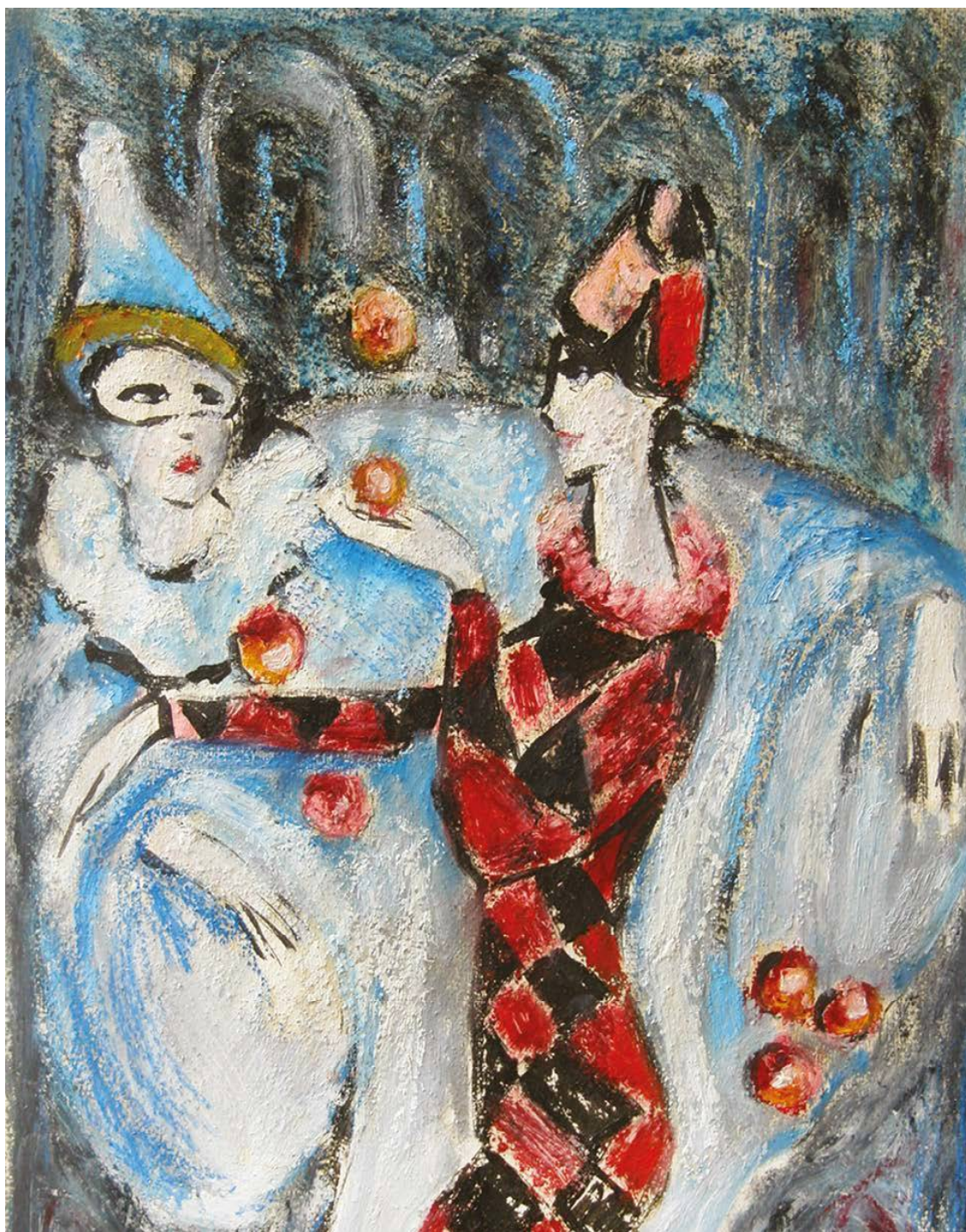
Игра в шарики. 2008 Холст, масло. 40×60 см