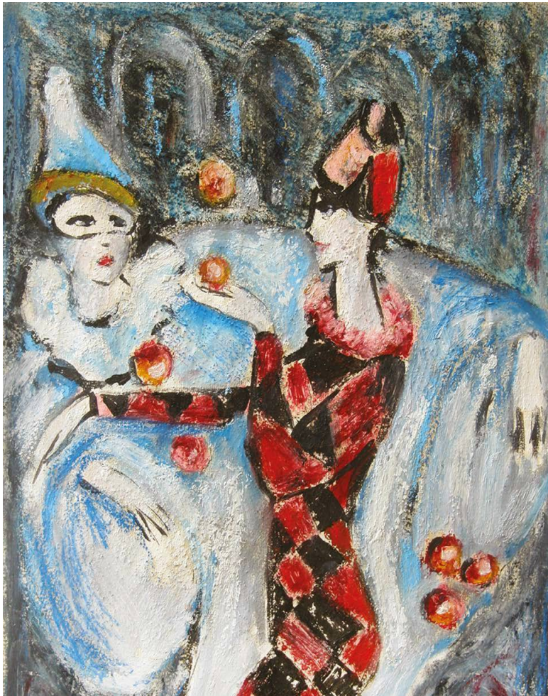
Игра в шарики. 2008