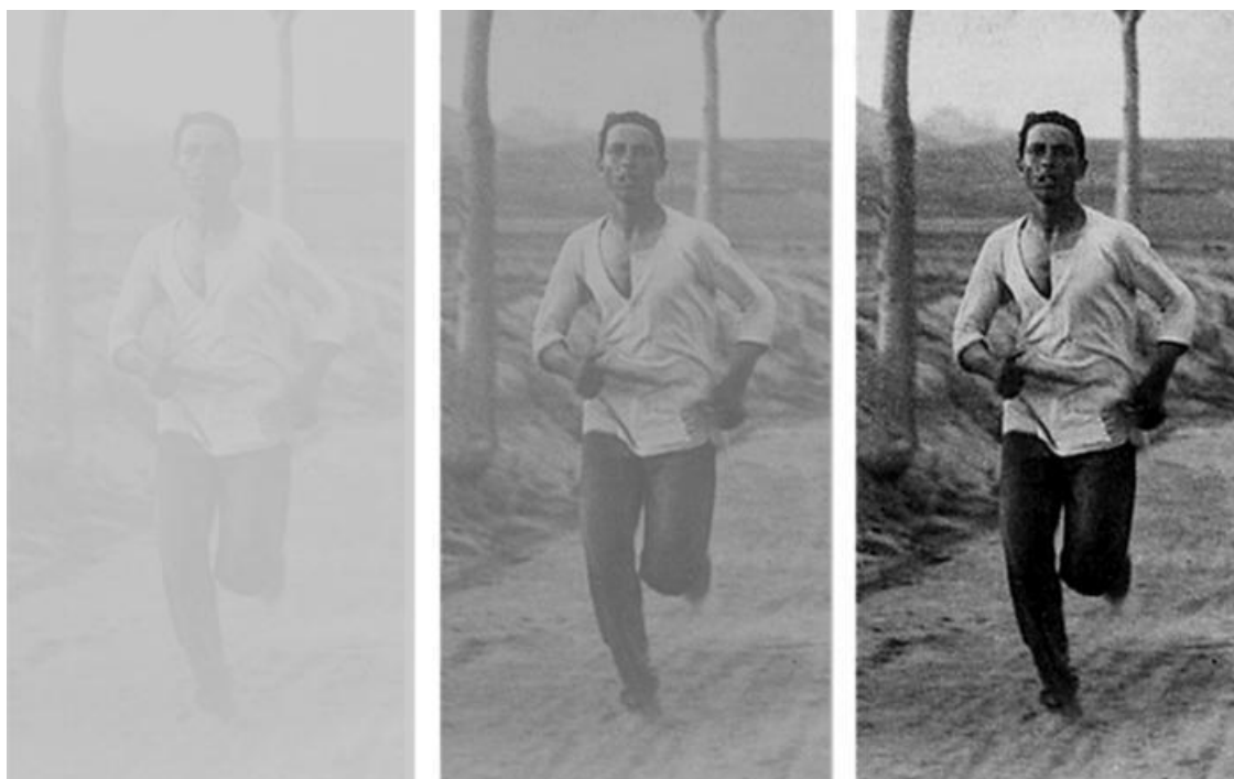
Известны случаи таинственного исчезновения людей во время бега