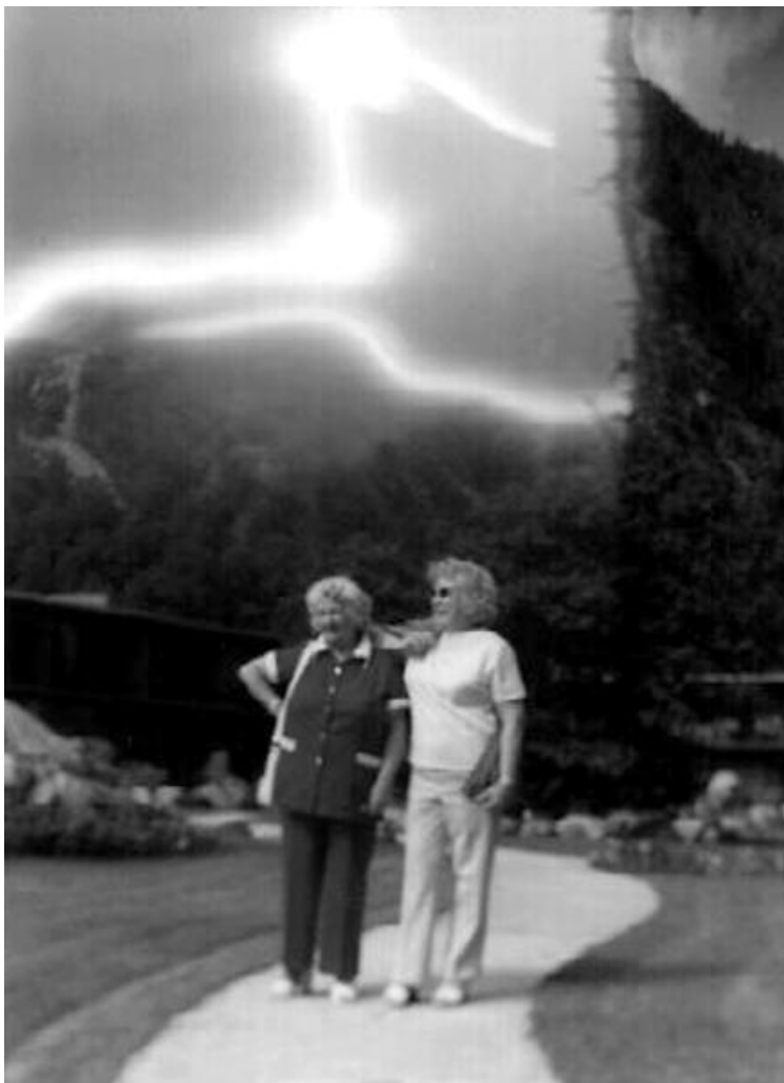
Загадочные небесные объекты различаются по форме, цвету и размерам