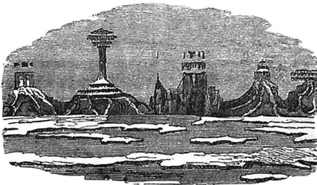
Рисунок, сделанный У. Скоресби у берегов Гренландии в 1820 г.

Свидетелем появления в воздухе невероятного города стал известный полярный путешественник Уильям Скоресби. 18 июля 1820 года в 9 часов утра корабль, на котором находился Скоресби, подошел к очередному, еще не исследованному берегу Гренландии. Когда капитан начал его зарисовывать, то, к своему немалому изумлению, заметил, что очертания береговой линии стали меняться. Он тут же достал подзорную трубу и приложил к глазу. Картина, увиденная Скоресби, походила на фантастический рисунок.