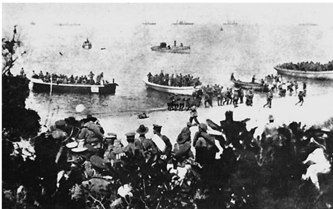
Высадка английских войск в Дарданеллах

А вот что по этому поводу заявили очевидцы события – двадцать два новозеландских пехотинца: