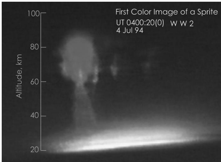
Фотография спрайта, сделанная в 1994 г.

Когда был открыт люк, все, кто в это время находился рядом, ужаснулись: все пассажиры были мертвы. И только командир еще подавал признаки жизни, но и он через несколько минут скончался.