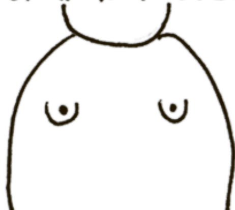
МНОГОШУМА ИЗ НИЧЕГО