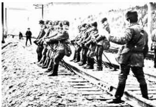
Рихтовка ж/д пути