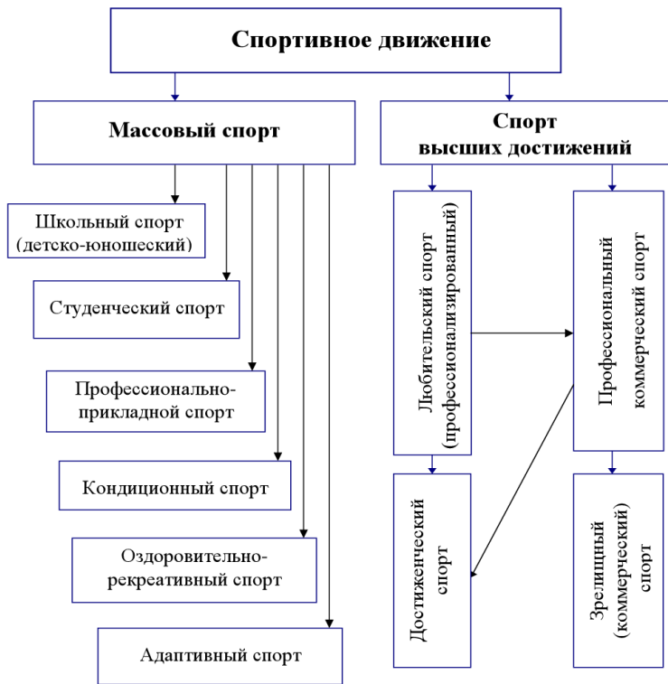
Рис. 1.1. Основные направления развития современного спортивного движения

Массовый общедоступный спорт имеет следующие разновидности: детско-юношеский или школьный, студенческий, профессионально-прикладной, кондиционный, рекре-