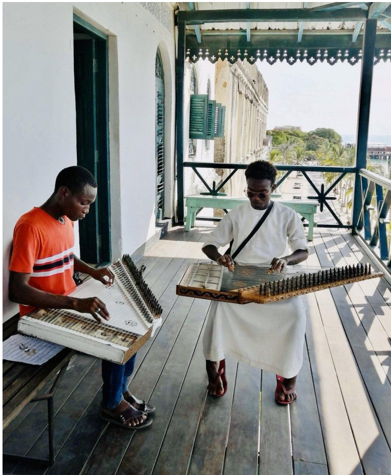
Музыканты играют на кануне. Музыкальная академия Доу. Март 2021