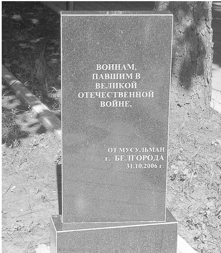
Белгород. Памятник на Курской дуге