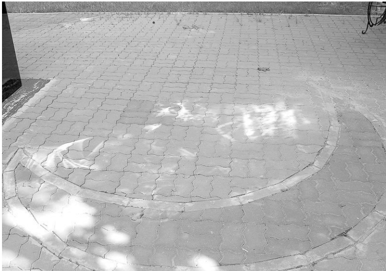
Деталь отделки памятника воинам-мусульманам