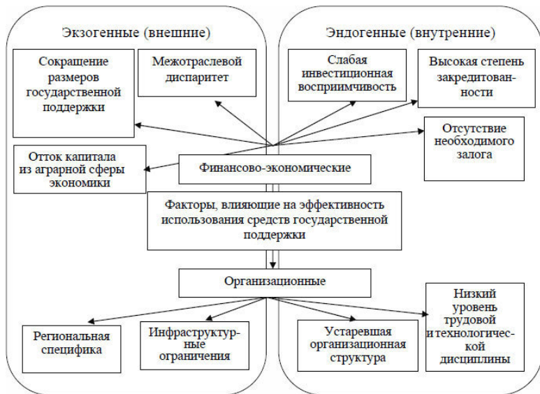
Рисунок 3 – Факторы и причины неэффективного использования аграрными организациями средств государственной поддержки