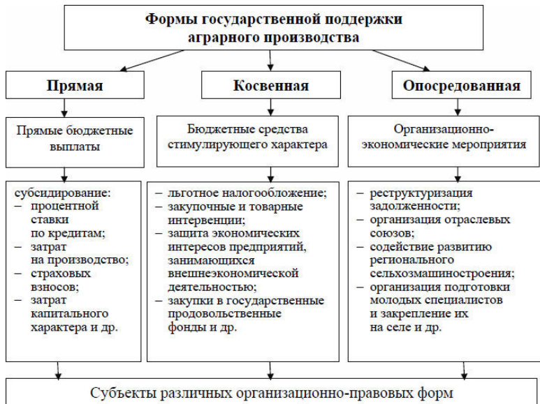
Рисунок 2 – Формы государственной финансовой поддержки сельхозтоваропроизводителей

Первая – форма прямой бюджетной поддержки – включает предоставление субсидий на материально-технические ресурсы и сельскохозяйственное производство, субсидирование краткосрочного и инвестиционного кредитования организаций и предприятий агропромышленного комплекса, предоставление субсидий сельхозтоваропроизводителям на возмещение части затрат по страхованию урожая сельскохозяйственных культур, субсидирование расходов капитально-