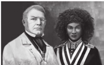
Губернатор и вице-губернатор

В ближайшие дни в сенате Элендася состоится голосование по вопросу, который ведущий политический эксперт Билминга, профессор Гарвен Мюни, называет «самым монументальным вызовом нашей правительственной системе со времен Слов Основания».