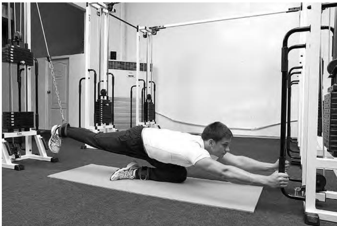
Фото 2 в

И.П. То же. Только вместо амортизатора используется тренажер.