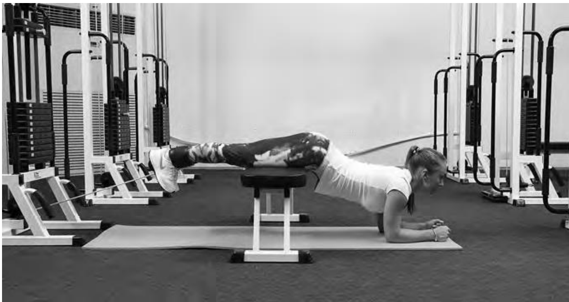
Фото 1 а

И.П. Стоя на четвереньках, упор на локти, нога зафиксирована с помощью манжеты за нижний блок тренажера, бедро лежит на скамье так, чтобы колено свободно свисало. На выходе «Хаа» сгибаем зафиксированную ногу, стараясь подтянуть пятку к ягодице, после чего полностью разгибаем.