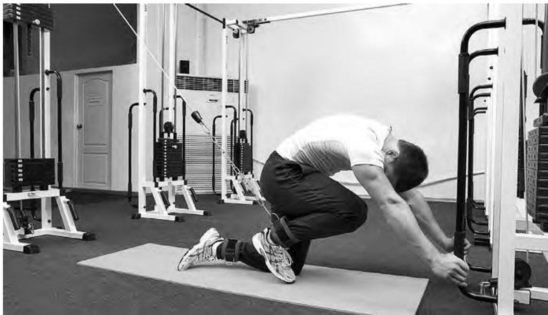
Фото 2 г

В) Отведение (внешняя поверхность) «АБДУКЦИЯ» (отведение) (фото 3 а, б, в, г)