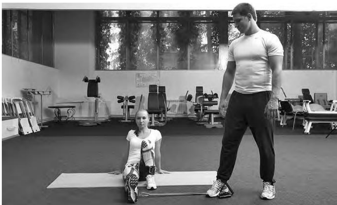
Фото 3 а

И.П. То же, что и в упражнении Б, только выполняется отведение прямой ноги максимально в сторону. Амортизатор необходимо зафиксировать за неподвижную опору или воспользоваться услугами партнера.