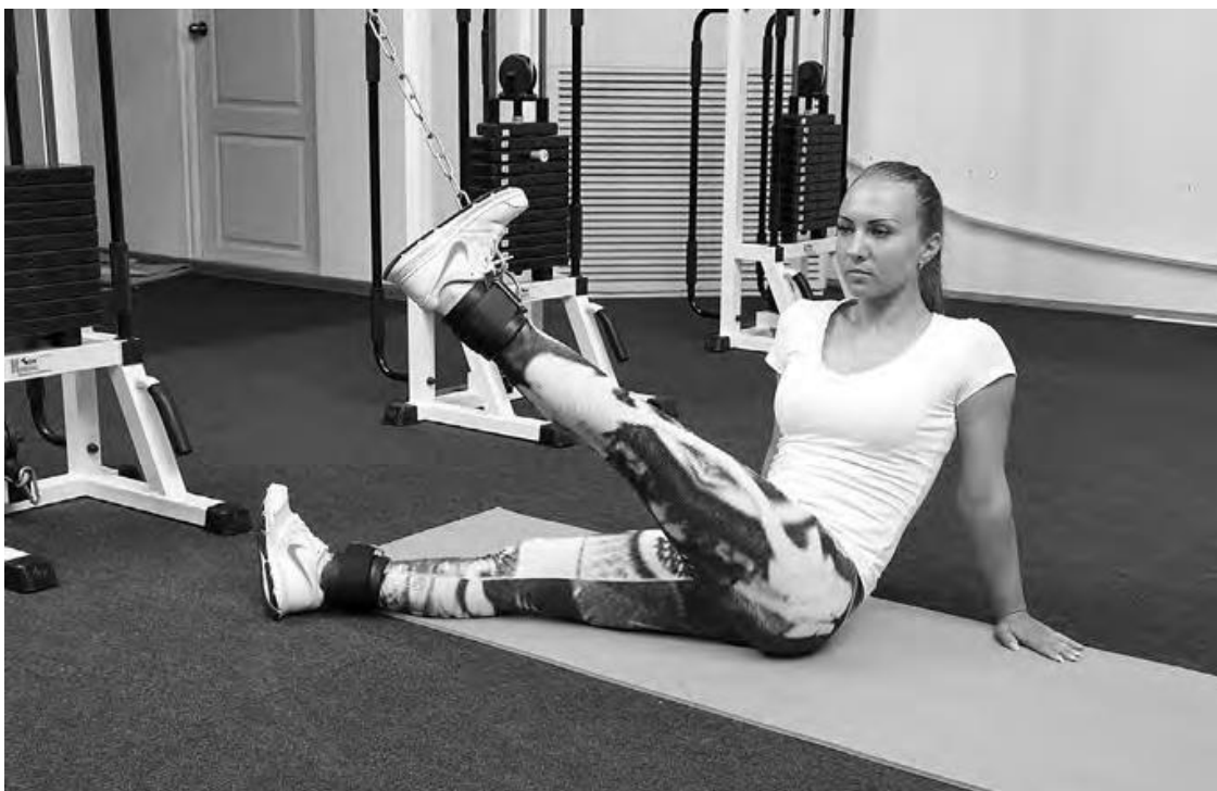
Фото 3 в

И.П. То же, что в упражнении Б. Отведение выполняется прямой ногой, зафиксированной с помощью манжеты к верхнему блоку тренажера.