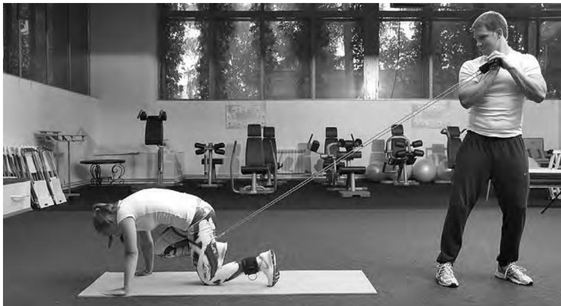
Фото 2 б

Можно работать с партнером. Тяга коленом вперед из положения прямой ноги назад.