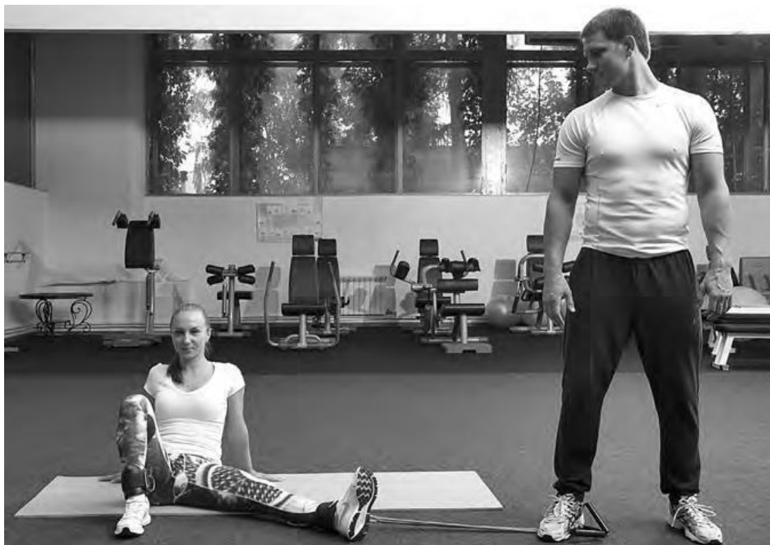
Фото 4 б