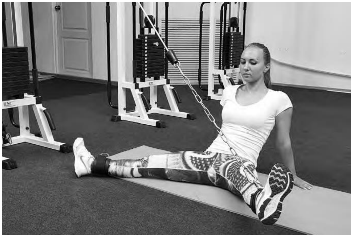
Фото 3 г

Г) Приведение (внутренняя поверхность) «АДДУКЦИЯ» (приведение) (фото 4 а, б, в, г)