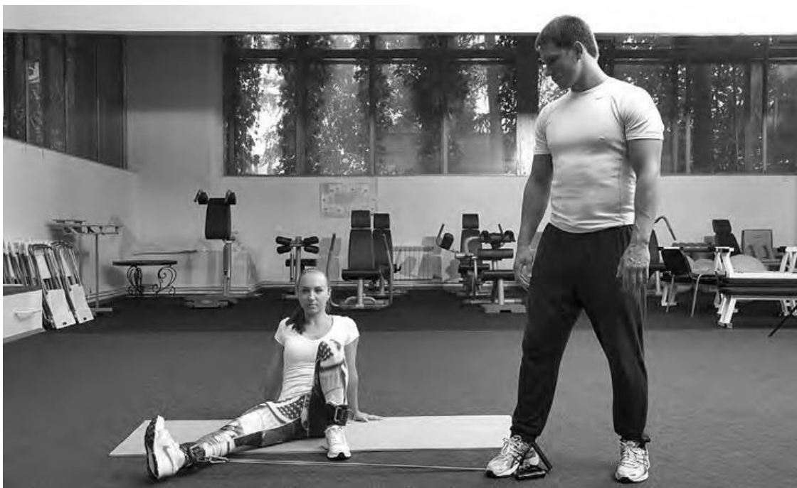
Фото 3 б