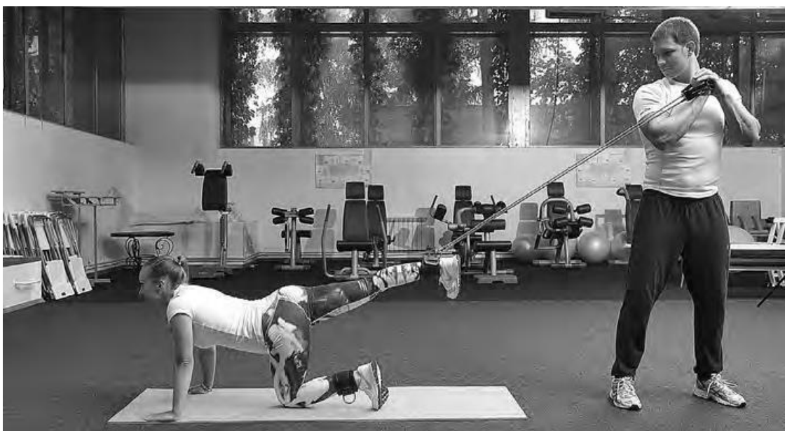
Фото 2 а

И.П. Стоя на четвереньках, упор руками в пол. Один конец резинового амортизатора зафиксирован в верхней точке комнаты, второй за манжету – к ноге (нижней трети голени).