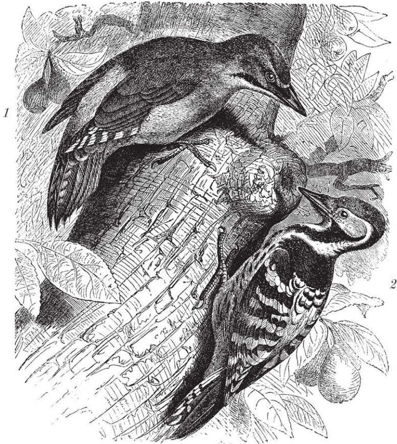
Дятлы: 1 – седой; 2 – белоспинный

Однако не следует думать, что черный дятел приносит один лишь вред. Эта птица оказывает нередко весьма зна-