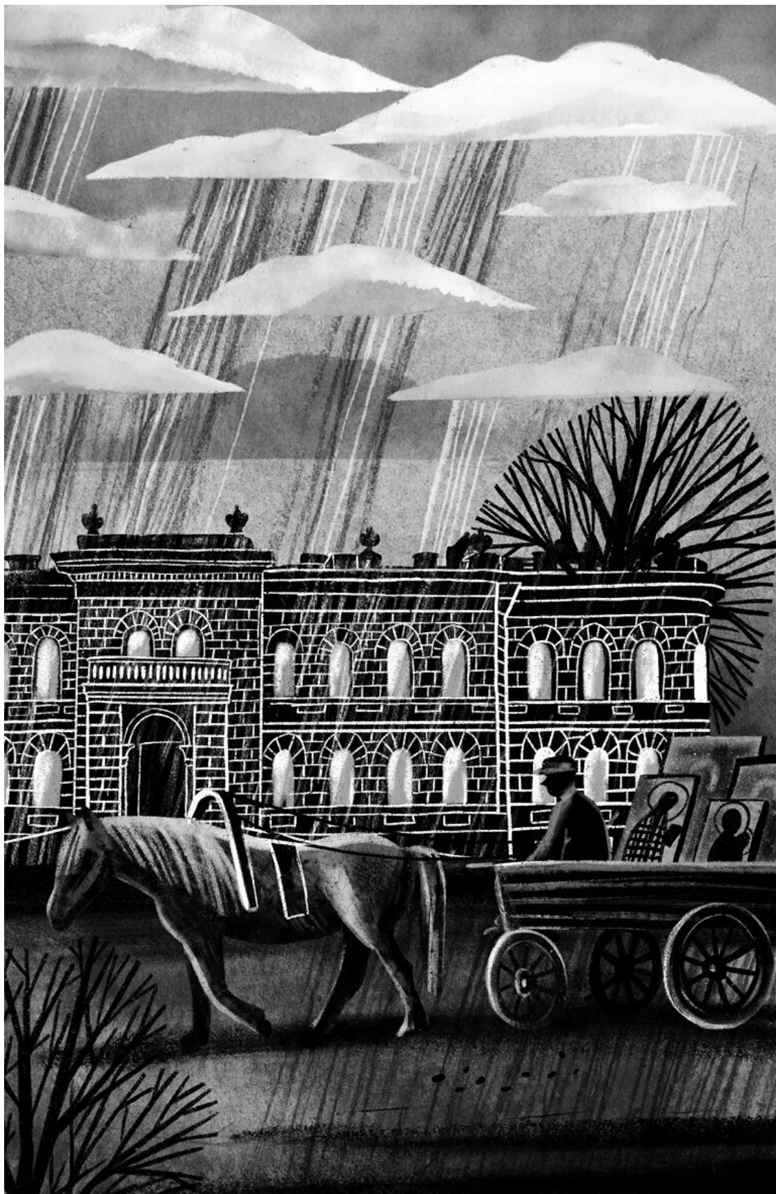
Иконы – в Зубаловский фонд