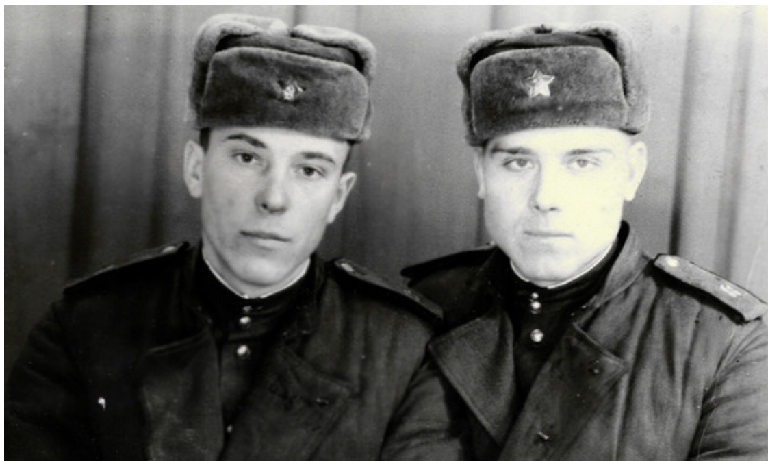
Отец (слева) с товарищем в период службы в Германии 1952 год.

и паучков. Путь был свободен, но я все же подстраховался, взяв с собой «палку-выручалку». Обошлось без приключений, я вернулся обратно домой, бабушка уже успела испечь блинчиков.