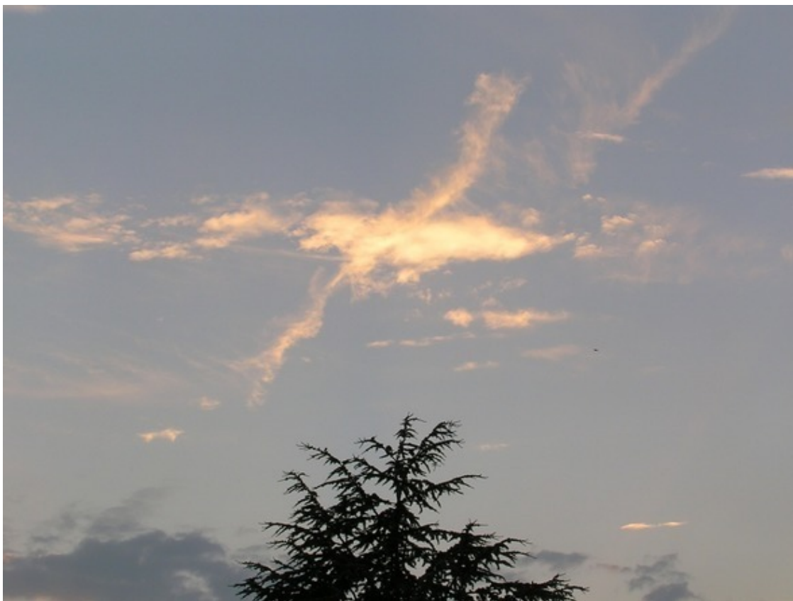
Дракон в полете

Следующая картинка была еще удивительнее, по небу проплыл огромный крест, я не знаю, каким образом солнце, вдруг, сыграло свою роль, потому что, он как будто светился золотом, и не был просто пушистым ватным крестом, он был золотой.