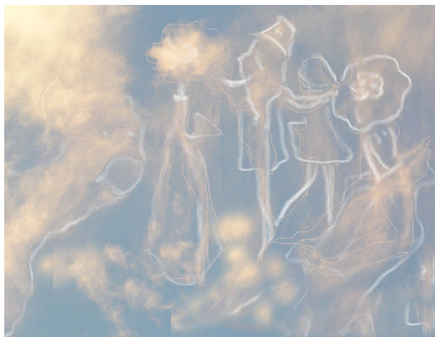
Прорисованные персонажи сказки

Под эти мысли я немного отвлеклась от зрелища, и когда снова посмотрела на небо, то увидела иллюстрацию к моей сказке, «Сказка Белого Облака» В этой сказке, девушки росинки испаряясь, превращаются в воздушных красавиц. Солнышко пригревает, и они плывут к небу на бал, который происходит раз в год на Белом облаке в его Замке. У девушек есть друзья-ветерки с поля, леса и озера. Они танцуют и разглядывают замок, прогуливаясь по его тропинкам и коридорам. Бродят по его сказочным залам и знакомясь с живущими на этом облаке. Они, даже, могут смотреть на землю, с края облака, как они это делают на картинке, которую я увидела.