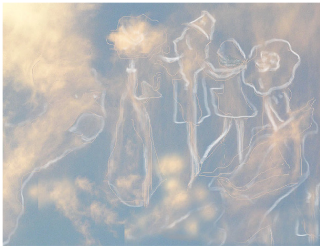
Прорисованные персонажи сказки

ей сказке, «Сказка Белого Облака» В этой сказке, девушки-росинки испаряясь, превращаются в воздушных красавиц. Солнышко пригревает, и они плывут к небу на бал, который происходит раз в год на Белом облаке в его Замке. У девушек есть друзья-ветерки с поля, леса и озера. Они танцуют и разглядывают замок, прогуливаясь по его тропинкам и коридорам. Бродят по его сказочным залам и знакомясь с живущими на этом облаке. Они, даже, могут смотреть на землю, с края облака, как они это делают на картинке, которую я увидела.