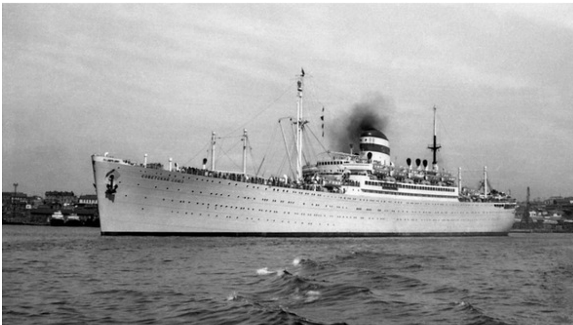
Советский пассажирский грузовой корабль Советский Союз в Советском Союзе (бухта Золотой Рог, Владивосток), 1957 год.