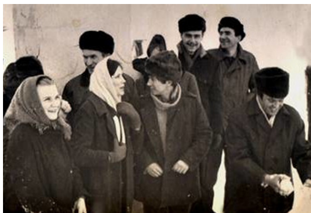
В Русской бухте. 8 марта 1971 год.