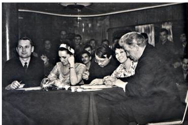
Жюри КВН: справа пассажирский помощник капитана теплохода Эрнст Николаевич, старшая номерная Людмила Сергеевна, слева представители пассажиров.