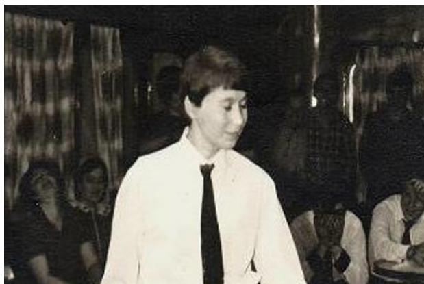
Конкурс капитанов. Пародия на капитана соперников.