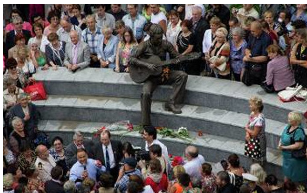
На открытии поющего памятника Владимиру Высоцкому. Владивосток, 2013 год.

В память о пребывании Владимира Высоцкого во Владивостоке в 1971 году там 27 июля 2013 года открыли первый в России поющий памятник В. Высоцкому. С этим материалом можно ознакомиться указанном под фотографией.