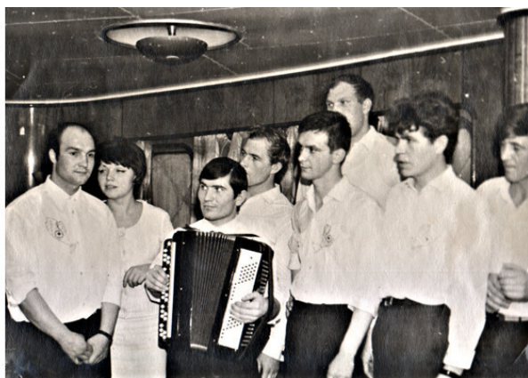
Команда КВН соперников – сборная пассажиров.