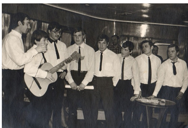
Команда КВН экипажа теплохода.