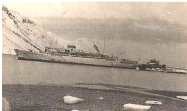
Теплоход «Феликс Держинский» в Русской бухте под загрузкой пресной воды. (Камчатка).

няли). И тогда второй говорит: «Да, от этих одесситов всего можно ожидать», – и они побежали дальше, и, наверное, рассказывали о чуде, которое они увидели.