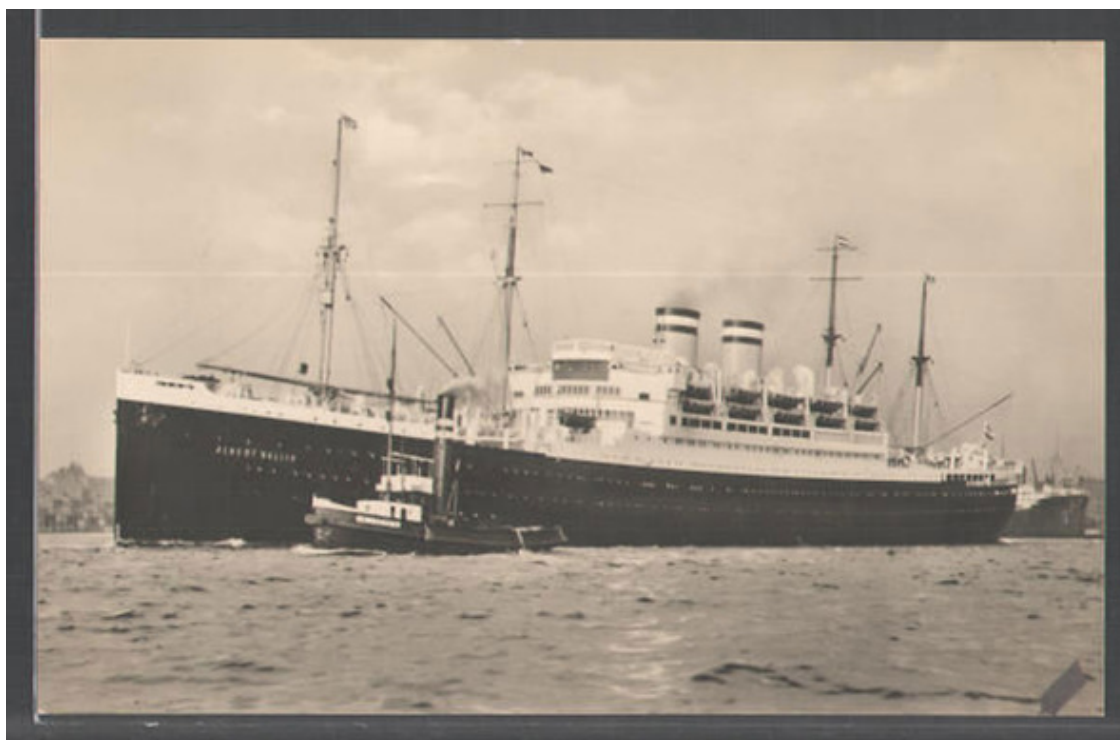
Лайнер «Albert Ballin» (Альберт Баллин), середина 1920-х годов

В годы Второй Мировой войны «Hansa» вошла в состав военно-морского флота Германии и перевозила военные грузы и войска. В марте 1945 года во время эвакуации германских войск из Восточной Пруссии «Hansa» подорвалась на mine и затонула на 20-метровой глубине в 9 милях от берега. В соответствии с решениями Потсдамской конференции руководителей трех союзных держав военно-морской и торговый флоты Германии были разделены поровну между странами-победителями в счет репараций 1 . В число судов, предназначенных для передачи СССР, попала и «Ганза». В 1949 года судно подняли, после восстановительных работ из двух дымовых труб осталась одна, от четырёх мачт с грузовыми стрелами остались только две.