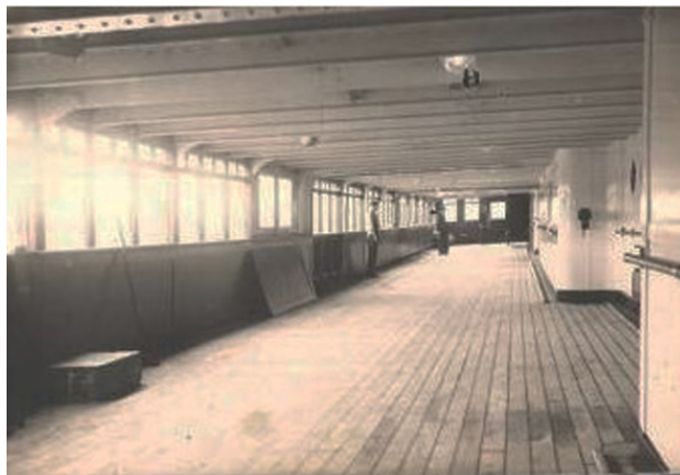
Закрытая прогулочная палуба. (Четыре жизни «Советского Союза»)

Здесь мы вечерами в свободное от вахты время танцевали с пассажирами, а, когда везли допризывников на Камчатку и Курилы или демобилизованных обратно, то военнослужащие здесь спали ровными рядами, выставив перед входом на палубу плакат, написанный от руки: «Девчата, просим не кантовать» . Таких пассажиров на судне умещалось до трёх тысяч.