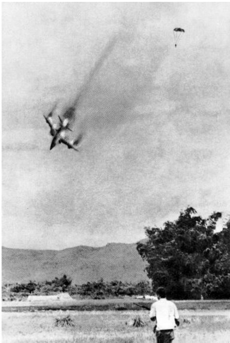
Вьетнам 1970-х гг. «Долетался». Американский самолёт, сбитый в небе Вьетнама.

Нам рассказывали вьетнамцы, что если сбитый лётчик на своём парашюте попадал в руки мирных крестьян, работающих на рисовых полях, у него не было шансов выжить. Его или насмерть забивали мотыгами или просто разрывали на части, потому что не было вьетнамских семей, где бы ни погиб хотя бы один человек. На улицах Хайфона мы видели много детей-калек, пострадавших от напалма или бомб.