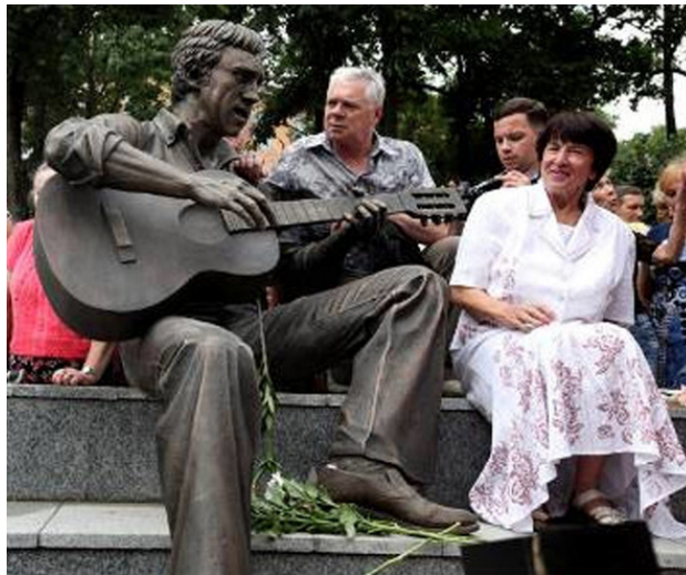
На открытии памятника Владимиру Высоцкому.

Списавшись с «Феликса Дзержинского», я устроилась на самый маленький сухогруз Дальневосточного пароходства — теплоход «Зея», который был зафрахтован 4 Вьетнамом на полгода. Я бы не написала эти воспоминания, если бы не те события, которые произошли с экипажем теплохода «Зея» в мае 1972 года, свидетелем и участником которых мне довелось стать.