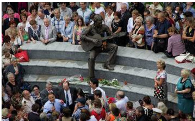
На открытии поющего памятника Владимиру Высоцкому. Владивосток, 2013 год.