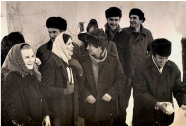
В Русской бухте. 8 марта 1971 год.