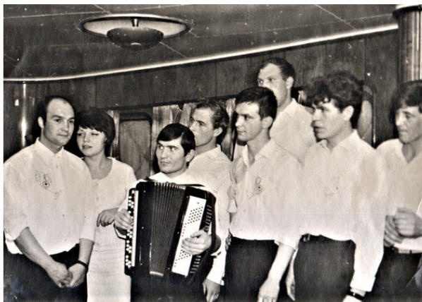
Команда КВН соперников – сборная пассажиров.