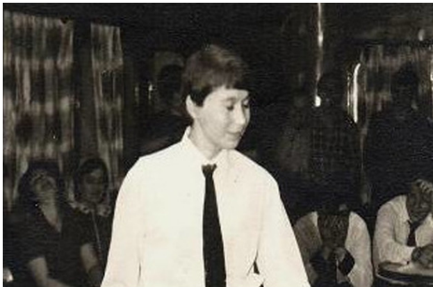
Конкурс капитанов. Пародия на капитана соперников.