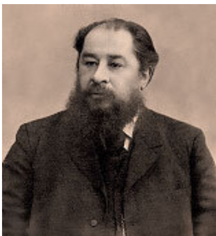
Николай Александрович ЛЕЙКИН 1841–1906