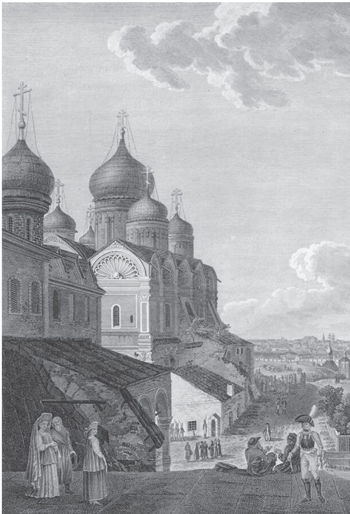
Вид на Москву с балкона Кремлевского дворца в сторону Москворецкого моста. Гравюра Ф. Лорие (?) по рисунку Ж. Делабарта. 1797. Фрагмент