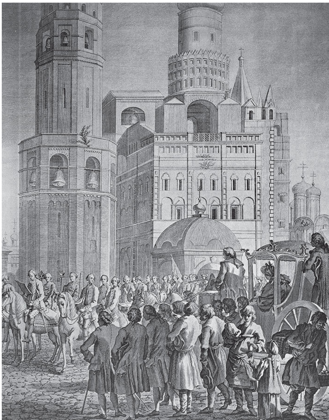
Обнародование манифеста о коронации Екатерины II на Соборной площади Кремля 18 сентября 1762 года. А. Мельников с гравюры А. Колпашникова по оригиналу Ж. Девельи и М. Махаева. 2-я пол. XIX в.