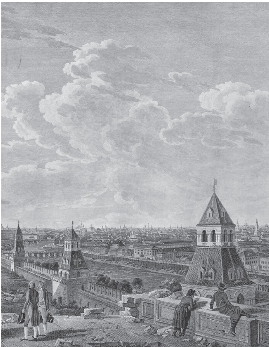
Вид на Москву с балкона Кремлевского дворца в сторону Москворецкого моста. Гравюра Ф. Лорие (?) по рисунку Ж. Делабарта. 1797. Фрагмент