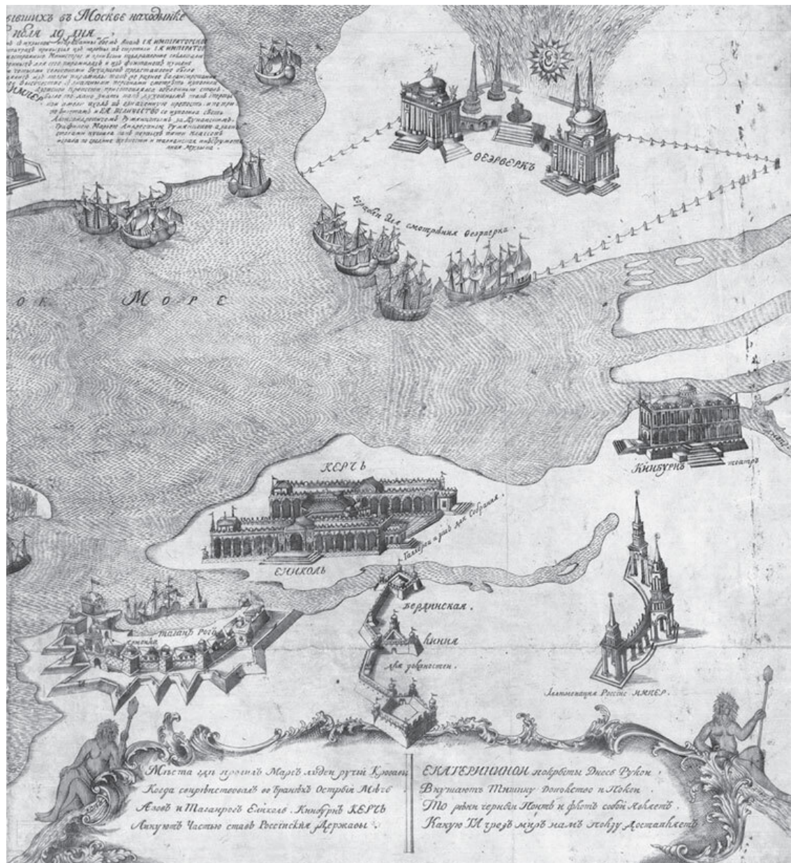
Петровский дворец близ Москвы. Литография А. Дюрана. 1840-е