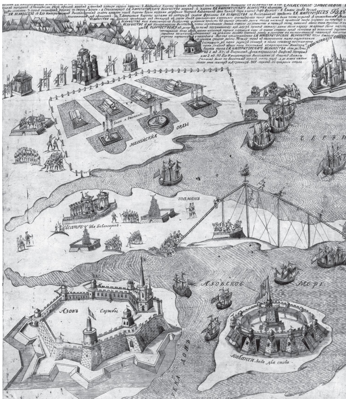
Панорама увеселительных строений на Ходынском поле в честь празднования победы над Турцией. 1775. Фрагмент