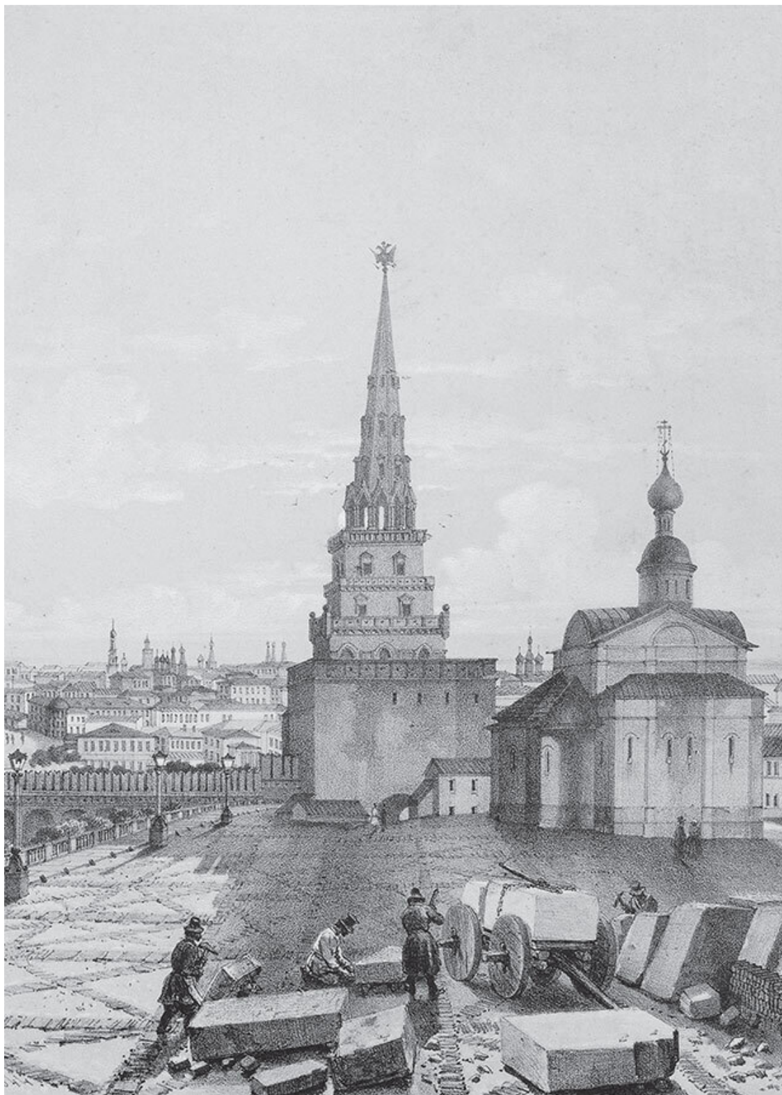
Вид на Москву из Кремля. Литография А. Дюрана. 1844. Фрагмент