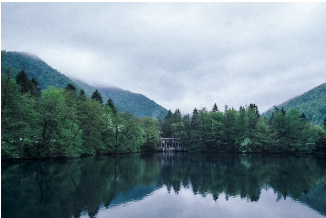
Фото из путешествий. Грузия