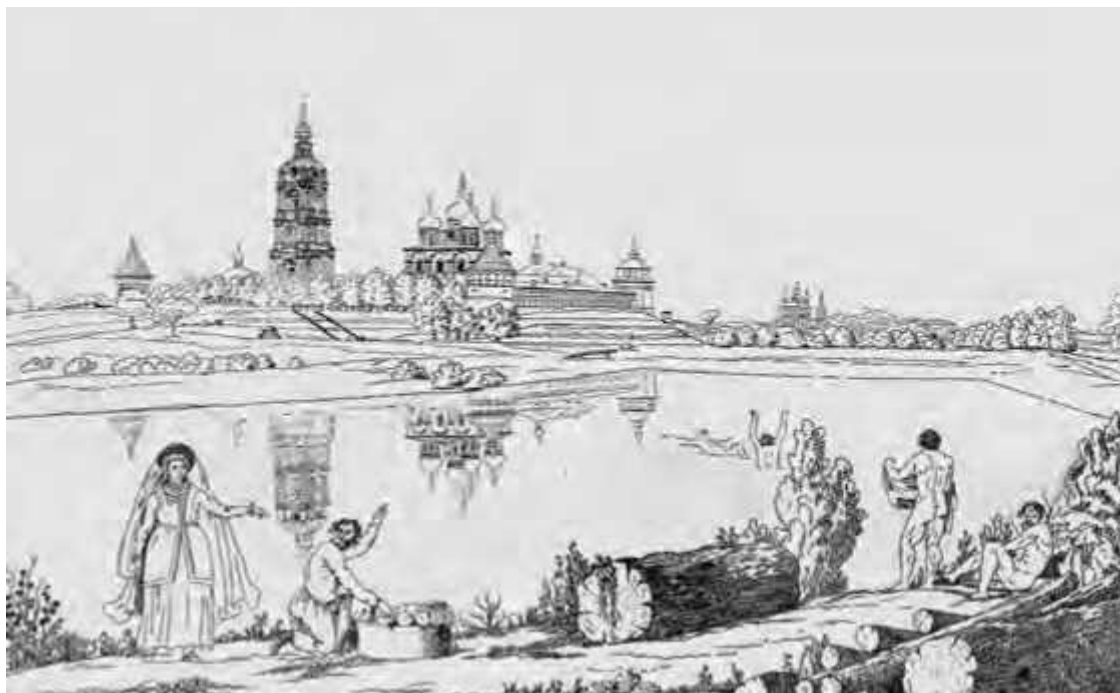
Новоспасский монастырь в Москве