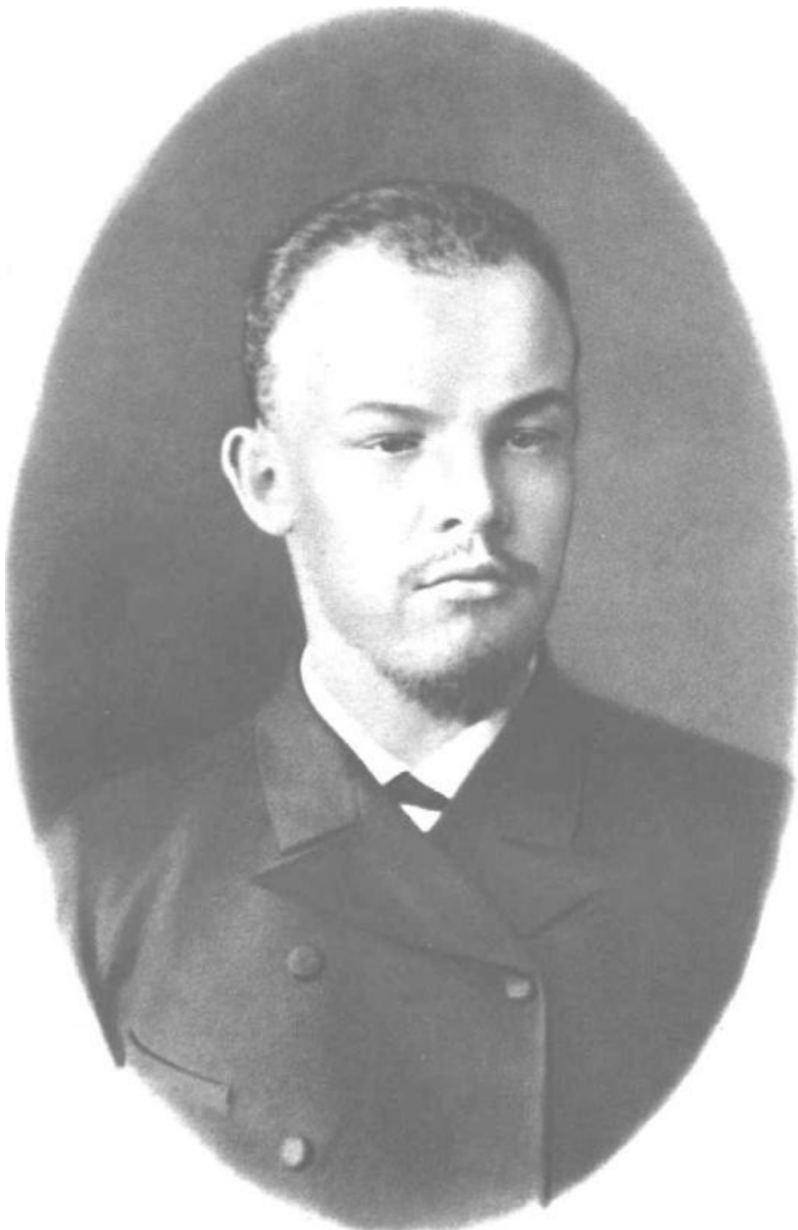
В. И. Ленин (1890–1891)