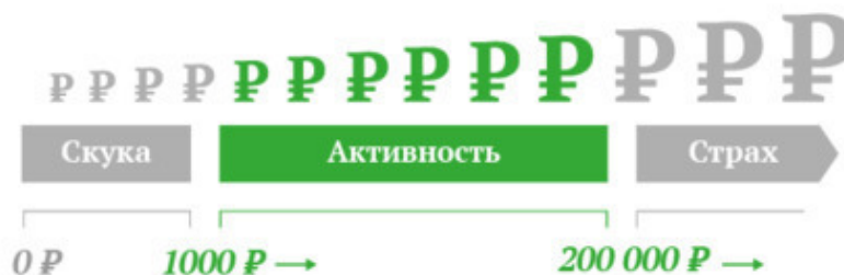
Рис. 1. Установки «финансового термостата»

Нижний предел настройки термостата определяется суммами, которые не вызывают никаких эмоций или вызывают скуку, а верхний предел – это уровень сумм, которые вызывают растерянность и незнание, что с ними делать. На рис. 1 эти суммы на шкале обозначены в 1000 и в 200 000 рублей. Это значит, что суммы ниже 1000 рублей не вызывают эмоций и не мотивируют к деятельности. Суммы выше 200 000 рублей воспринимаются как нереальные, и человек может быть растерян при оперировании такими суммами и может принимать неадекватные реальности и текущему положению дел решения.