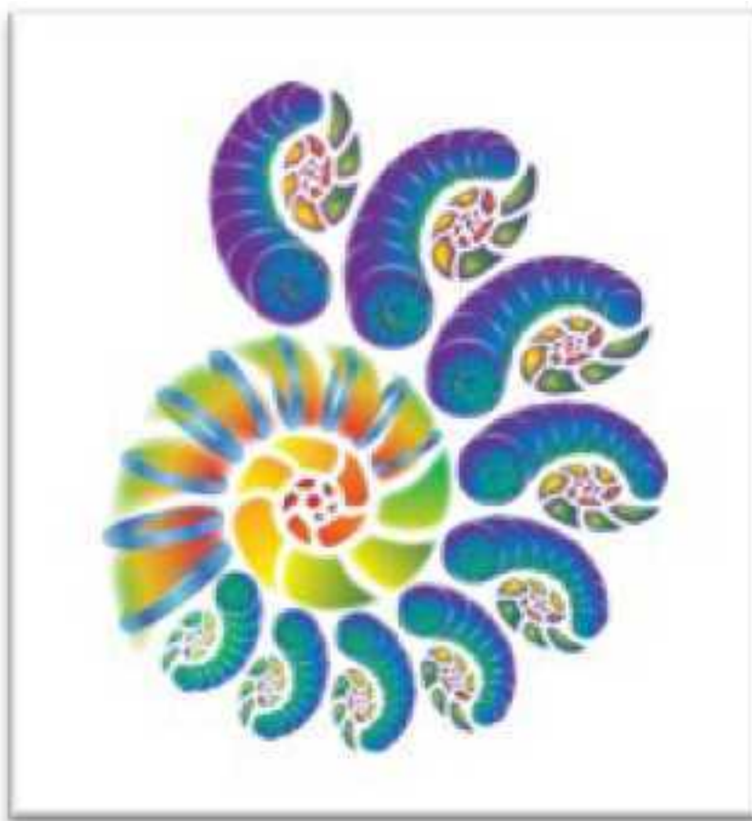
Рис. 2. Спираль Качеств

4. Точка схлопывания Спирали Качеств заполнена 22 Большим Арканом; описывает физическое тело человека