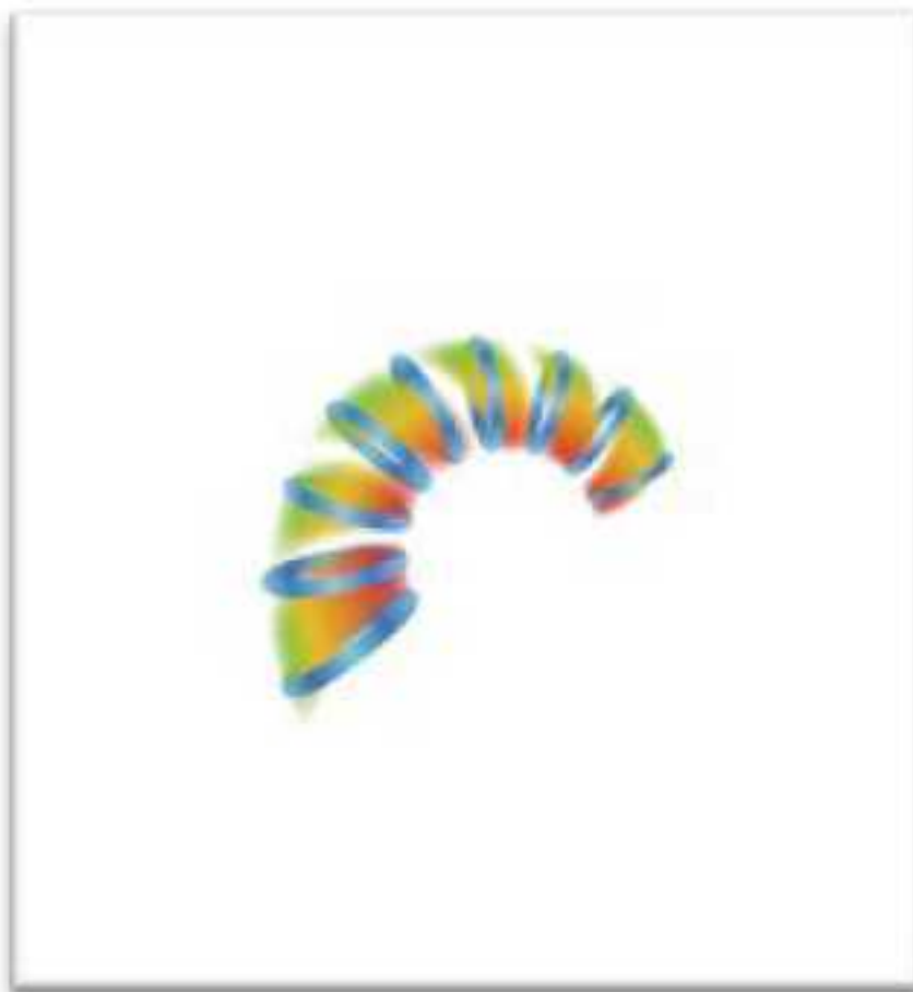
Рис. 4. Второй виток Спирали Качеств

Продолжая эксперимент и понижая активность ресурсов человека, в человеке выделяются психические свойства, как производные от биохимических: