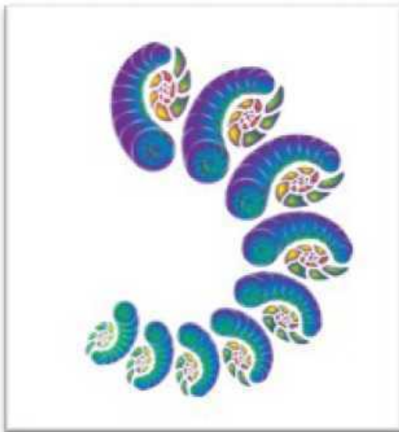
Рис. 3. Первый виток Спирали Качеств

Представим, что некоторый человек, находясь в искусственных условиях, достиг 100 % активности своего биологического ресурса. Он сам является базовой фрактальной формулой, описывающей все возможные свойства архитектуры человека. Далее предположим, что активность его психики понижается, и зафиксируем стабильные состояния, возникающие в результате эксперимента. Согласно системы ТАРО, проявятся следующие стабильные состояния: