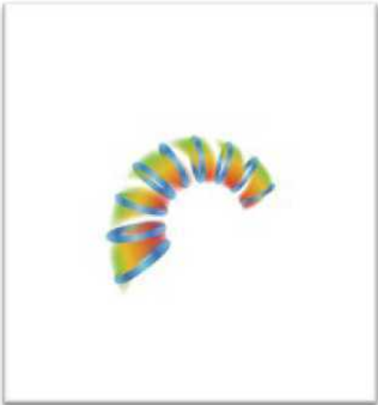
Рис. 4. Второй виток Спирали Качеств

Продолжая эксперимент и понижая активность ресурсов человека, в человеке выделяются психические свойства, как производные от биохимических: