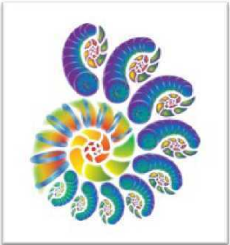
Рис. 2. Спираль Качеств

В рамках одной системы взаимосвязь несоизмеримых объектов должна была бы противоречить базовым законам точных наук (например, метры и килограммы между собой