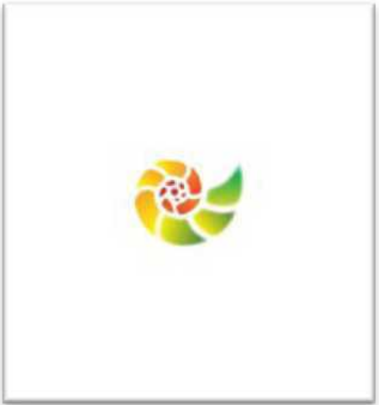
Рис. 5. Третий виток Спирали Качеств и Точка схлопывания

Девять качеств второго витка Спирали Качеств и модель взаимодействия этих качеств между собой в современ-