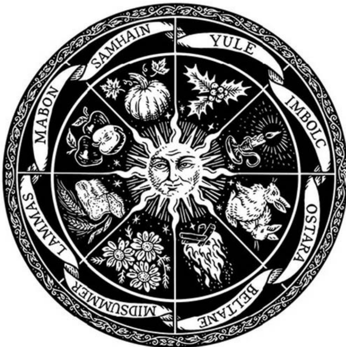
Рис. 1. Колесо Года

Термин «шабаш», вероятно, пришел из древнего французского языка и происходит от еврейского «шабат», что означает «отдыхать» 11 . То, что слово «шабаш» (sabbat) напоминает слово «шабат», или «суббота» (sabbath) – не случайное совпадение. В Средние века и в начале Нового времени праздники ведьм часто называли ведьмиными субботами , в какой бы день недели те ни происходили. В большинстве английских книг о колдовстве, изданных до 1950-х годов, собрания ведьм почти всегда называются субботами.