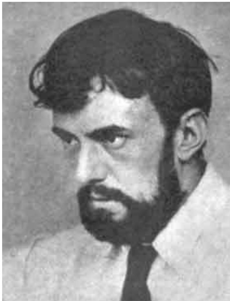
Алистер Кроули. Цейлон (ныне Шри-Ланка). 1901