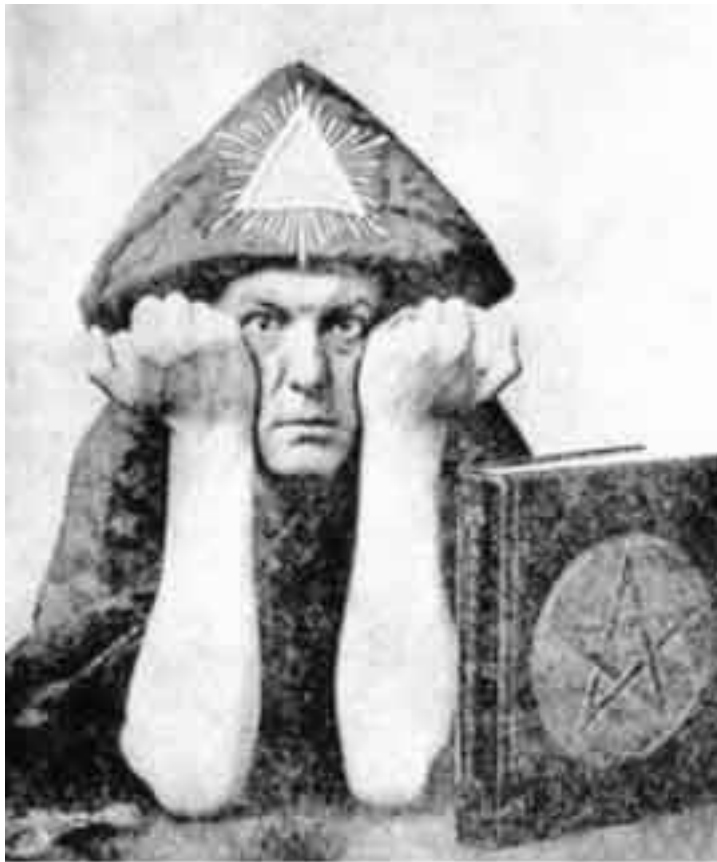
Алистер Кроули

Положение Нептуна в X доме также позволяет предполо-