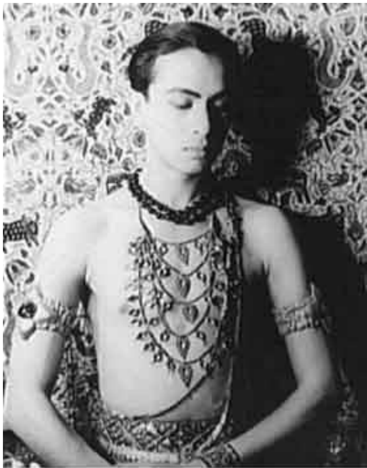
Рам Гопал.