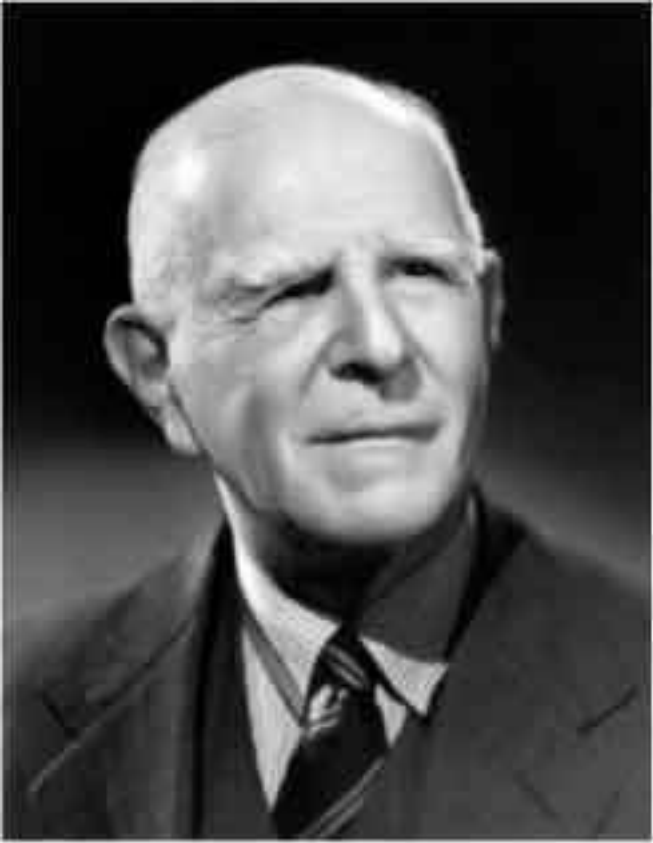
Перси Харрис