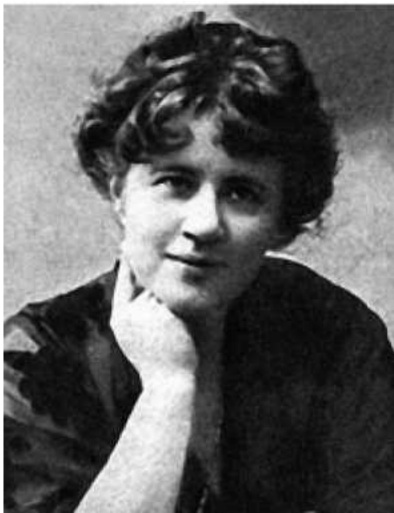
Татьяна Львовна Щепкина-Куперник

Но в очерке имеются и пробелы. Пробелы эти вызваны, вероятно, тем обстоятельством, что в распоряжении З.Ливицкой оказались неполные комплекты использованных ею газет.