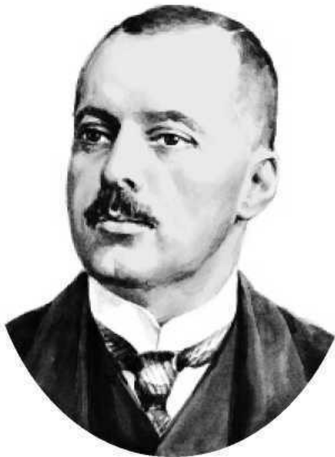
Владимир Дмитриевич Набоков