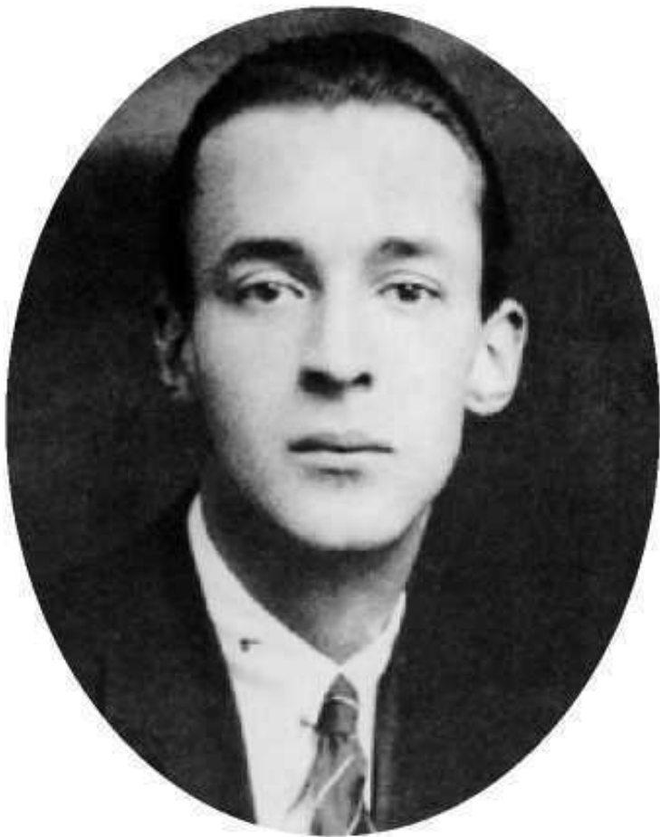
Владимир Владимирович Набоков