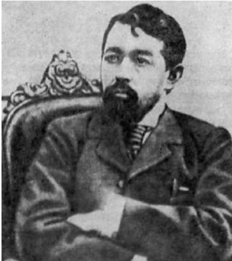
Сергей Яковлевич Елпатьевский

Вот дополнительная информация о деятельности Литературного общества имени А.П.Чехова, основанная на оста-