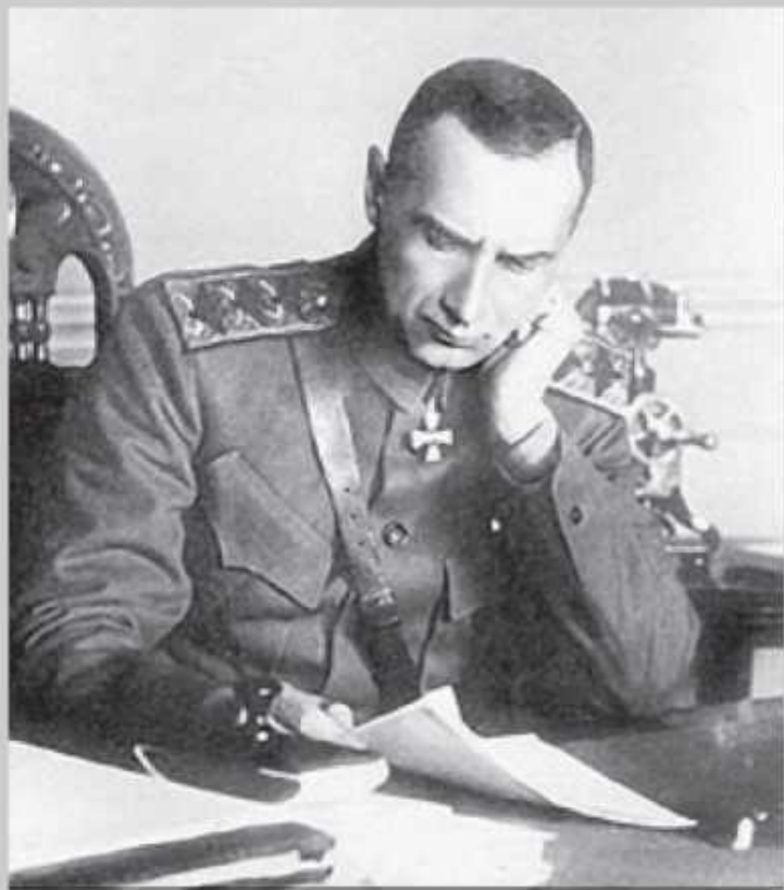
Александр Васильевич Колчак