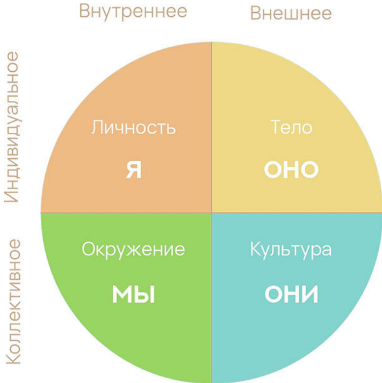
Рис. 1. Модель интегрального видения Кена Уилбера

Она может показаться сложной, но я раскрою ее суть.