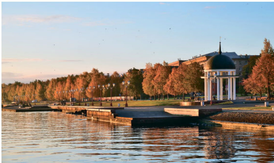
Закат на набережной Онежского озера