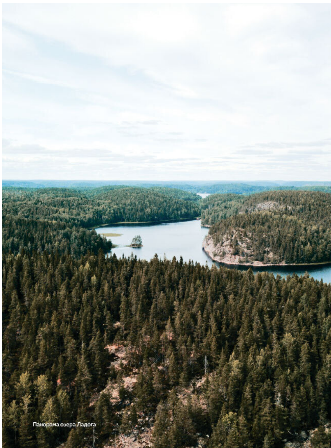
Панорама озера Ладога

Двадцатый век принес Карелии очередные испытания. 4 декабря 1917 года Финский сенат принял декларацию независимости Финляндии, которая была одобрена парламентом. 31 декабря Ленин подписал постановление совета народных комиссаров о признании независимости Финляндской республики.