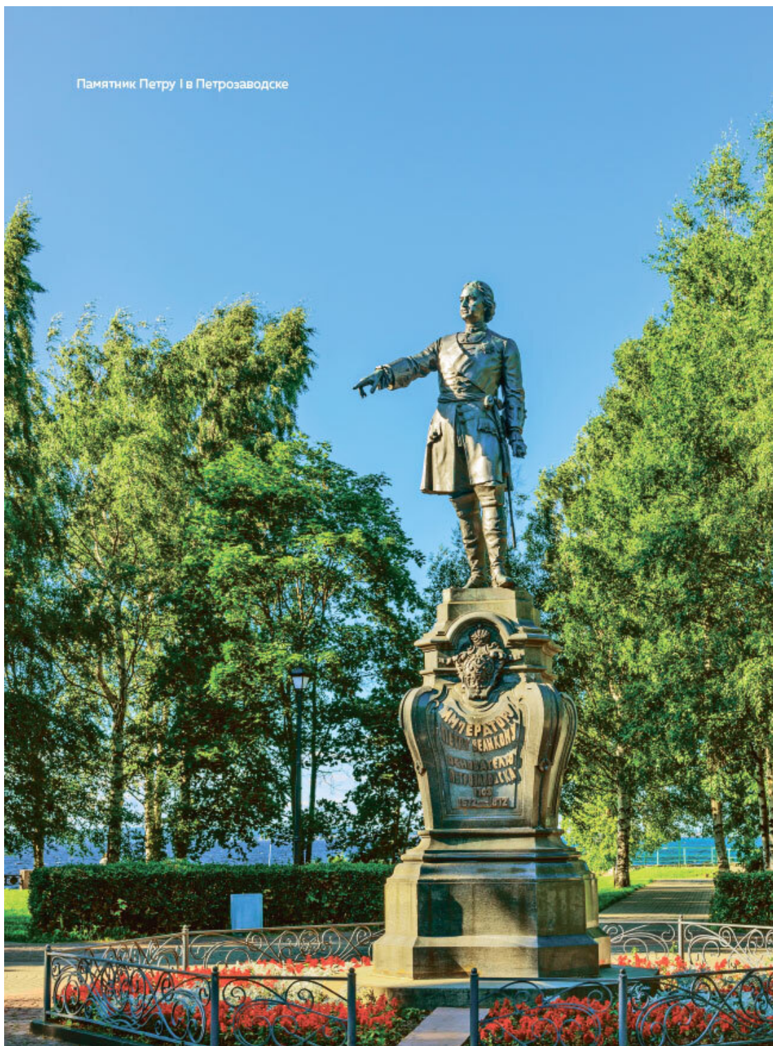
Памятник Петру I в Петрозаводске