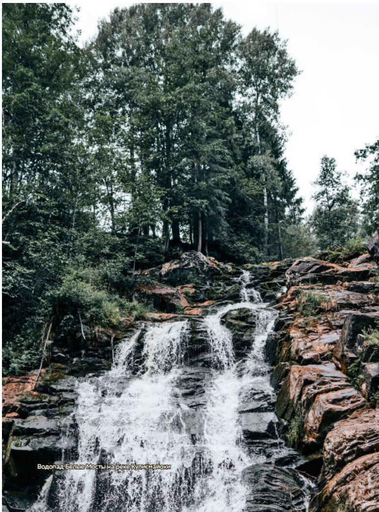
Водопад Белые Мосты на реке Кулсмайоки