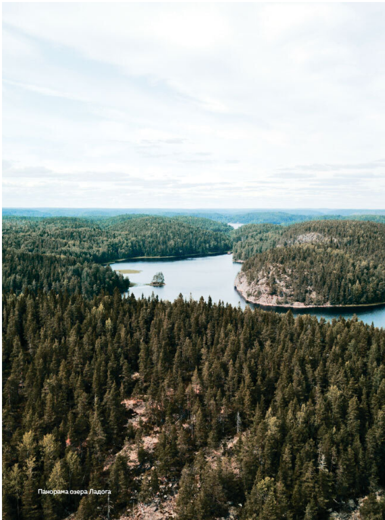
Панорама озера Ладога