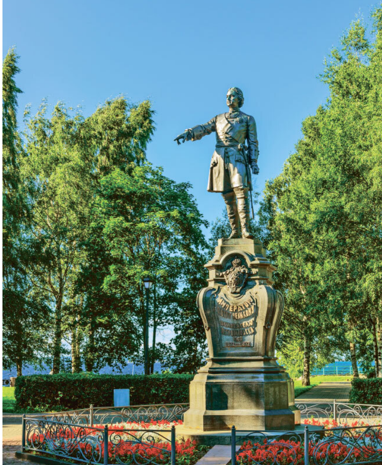
Памятник Петру I в Петрозаводске