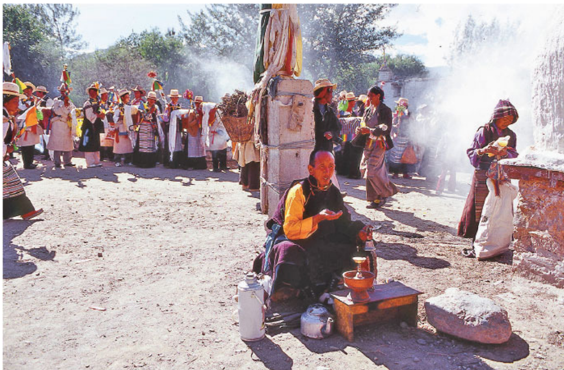
Колдун за работой

Во многих отдаленных районах, где влияние тибетского буддизма было относительно слабым, сегодня сохранились некоторые магические религиозные практики, такие как баймо в районе Байма и патицу в районе Мяннин. Наследование и иерархия служителей культа в этих практиках происходит главным образом от божественных прав, дарованных во сне, и в малой степени – от отца к сыну или от мастера к ученику. У них есть свои заклинания, молитвы и жертвоприношения.