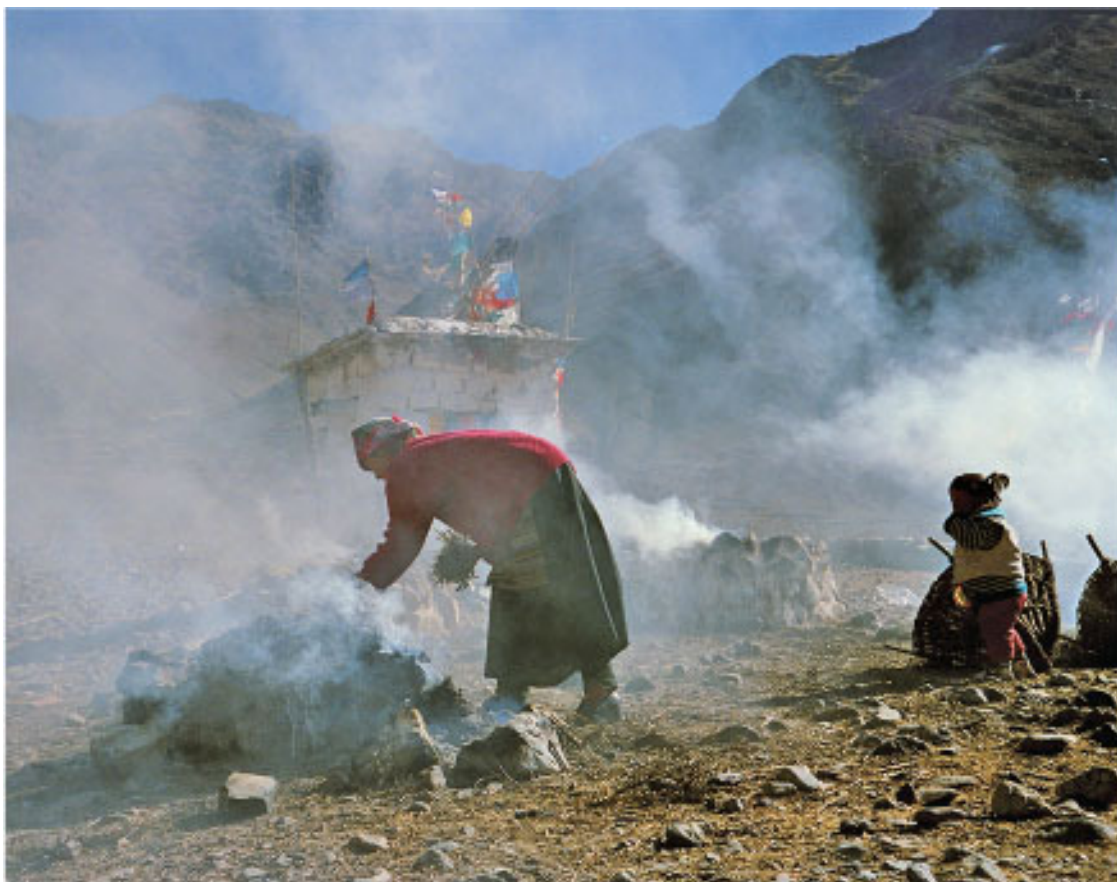
Религиозный ритуал – сжигание благовоний