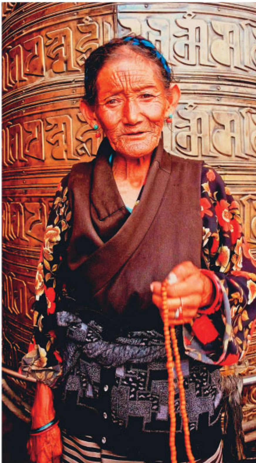
Пожилая женщина читает сутры

«Трипитака» – свод важнейших священных текстов буддизма. Тибетский его вариант имеет много общего с китайским, но все же отличается. Канон на тибетском языке разделен на две части в соответствии с основным содержанием: Кангьюр (слова, приписываемые Будде) и Тенгьюр (комментарии, написанные индийскими мастерами дхармы).