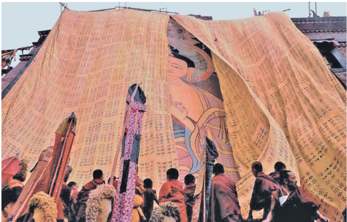
Праздник Будды в монастыре Ганден